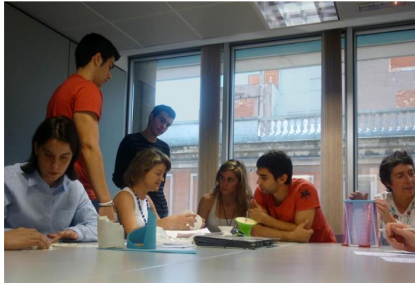
Figura 2. Evaluación de modelos geométricos por usuarios discapacitados