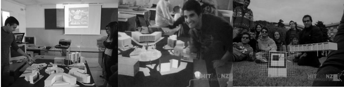
Figura 4. Desarrollo de proyectos con RA en escala de maqueta y en exterior