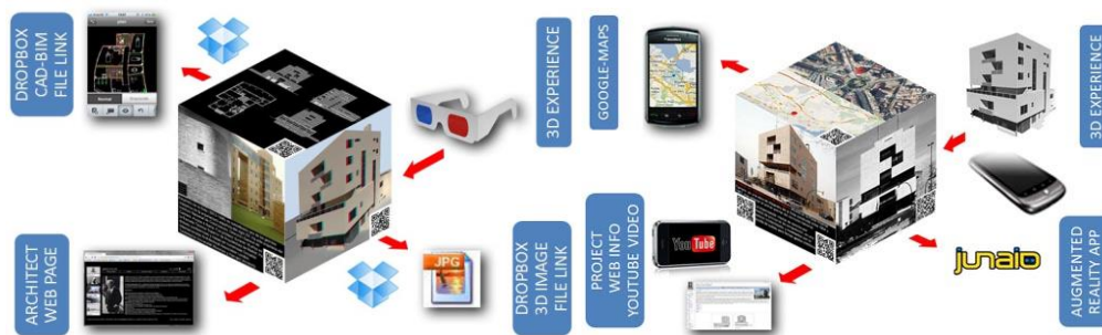
Figura 5. Contenidos interactivos y Realidad Aumentada