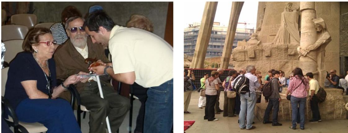
Figura 3. Experiencia de usuario e implementación