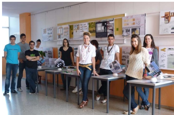
Figura 6. Presentación de contenidos en exposición