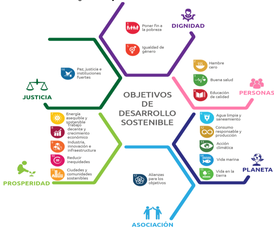
Figura 1. Objetivos del desarrollo sostenible