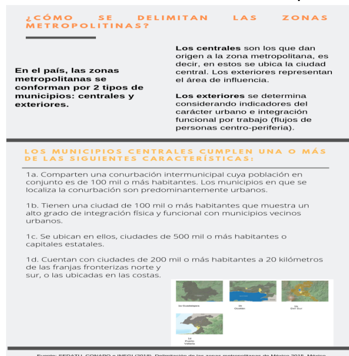
Figura 1. Infografía del método de Delimitación de las zonas metropolitanas de México 2015

Por todo lo anteriormente expuesto se hace necesario tomar como punto de partida el asentamiento humano de mayor concentración “Municipios Centrales declarados como zonas y/o áreas metropolitanas”, además de ser el polo de desarrollo regional, esto genera un impacto positivo desde el punto de vista económico y negativo desde el punto de vista eco sistémico en el territorio (región hidrográfica), partiendo del análisis de los aspectos ecológicos, ambientales, sociales económicos, políticos y culturales que se pretenden abordar. Tomando en cuenta principalmente las vulnerabilidades naturales y antropogénicas que aquejan a estas zonas y/o áreas metropolitanas en su territorio, así como las repercusiones que están teniendo en el cambio climático y calentamiento global sobre la sustentabilidad. Las ciudades medias metropolitanas en Jalisco, México hoy en día se han convertido en un factor determinante del desarrollo global-local de las regiones y a la vez en territorio sin directrices, pues el impacto de cambio de usos del suelo del Territorio y Urbano no se tenía previsto, acrecentar el impacto hacia el medio ambiente y lo único que importa es la creación de empleos o el desarrollo económico de estos dos polos de desarrollo emergentes “Municipios Centrales declarados zonas y/o áreas metropolitanas”. Según la ONU-HÁBITAT (2016), las ciudades se dividen en