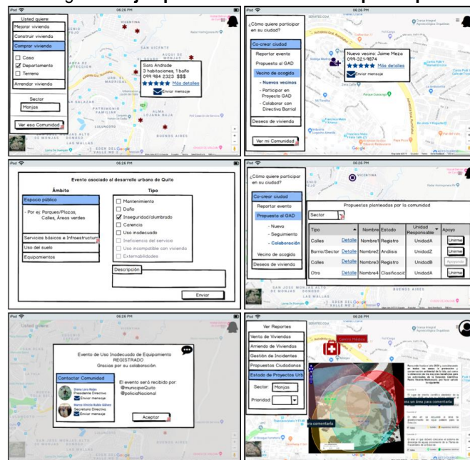
Figura 3. Ejemplo de diseño inicial del prototipo