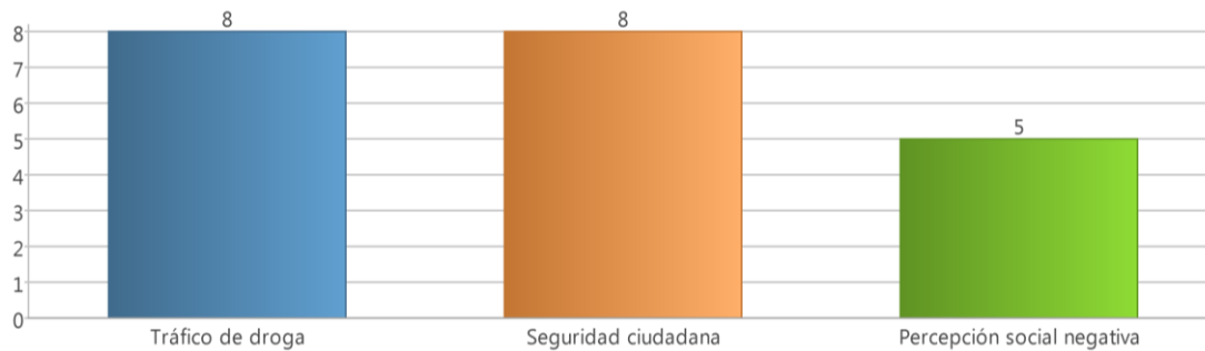
Gráfico 7. Factores de riesgo de El Gallito

La sensación de inseguridad ciudadana, unida a la percepción social negativa (tanto a nivel exógeno como endógeno) y el tráfico de droga, han sido los temas más señalados respecto a factores de riesgo: