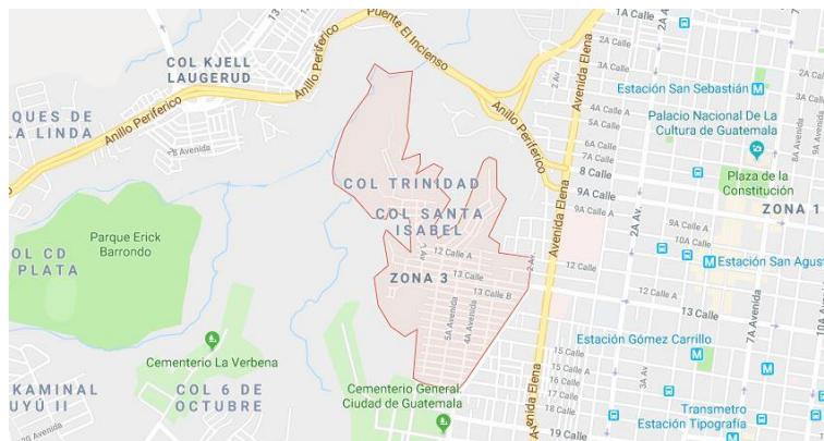
Mapa 2. Delimitación territorial del barrio de El Gallito

La ubicación geográfica del barrio de El Gallito, se encuentra en el área central de la ciudad capital, concretamente en la Zona 3 5 cuya zona cuenta con un total de 25.501 habitantes (Secretaría de Seguridad Alimentaria y Nutricional, 2009). 6