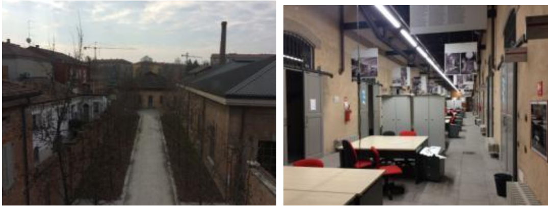
Fig. 5 Politécnico di Milano, sede de Piacenza en un antiguo matadero.

El máster “Sustainable Architecture and Landscape Design” se desarrolla en la sede que el Politécnico de Milán tiene en Piacenza (Italia), una ciudad media (en torno a cien mil habitantes) situada en región de la Emilia Romagna. En ella confluyen un rico centro histórico, que mantiene la trama fundacional romana; con el potente y aún salvaje cauce del río Po, que la limita por el norte; un entorno agrícola de alta calidad; y unas prósperas actividades económicas contemporáneas que están dinamizando un no muy afortunado crecimiento periférico.