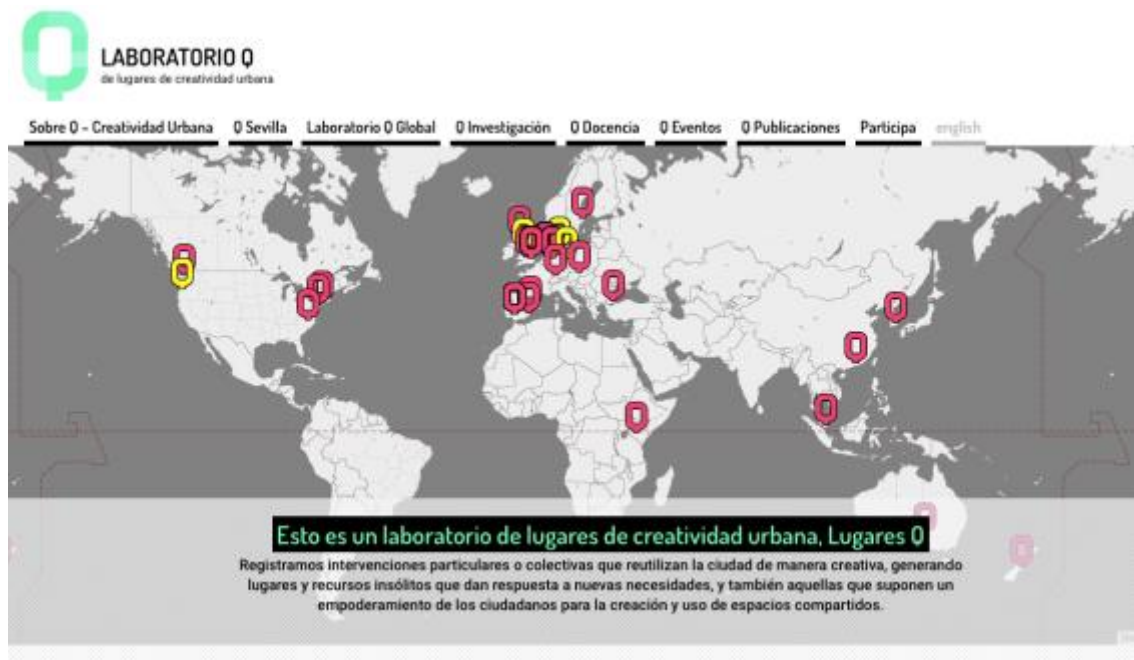
Fig. 2 Portal web Laboratorio Q de Lugares de Creatividad Urbana.

Este apartado explica la pretendida hibridación entre investigación y docencia que subyacía en esta propuesta. Para ello, por un lado, será necesario definir el corpus conceptual de Laboratorio Q que nutriría esta práctica, y por otro, se expondrán resumidamente otras dos experiencias docentes “Q” que sirvieron de antecedentes metodológicos para éste proyecto docente.