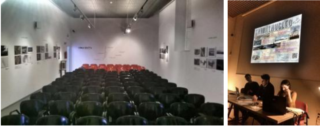
Fig. 4 Exposición de trabajos docentes en la IV Jornada Internacional Laboratorio Q. II Jornada de Acciones Urbanas, organizada en el Centro de Iniciativas Culturales de la Universidad de Sevilla.

En el curso académico recientemente finalizado, la práctica se centró en un estudio sobre los procesos de regeneración urbana creativa en otras ciudades andaluzas, Málaga, Cádiz, Granada y Córdoba. Laboratorio Q habilitó una plataforma paralela donde los estudiante, en modo de posts , documentaron un número limitado de acciones, espacios o procesos hallados en estas ciudades. Esta información quedaría publicada en la plataforma Laboratorio Q Docencia , un nuevo mapa documental de acceso libre. Además, como experiencia pionera de éste tipo en su formación, este trabajo sirvió como base para que los alumnos desarrollaran un artículo de investigación siguiendo las pautas de un proceso de publicación habitual de una revista científica.