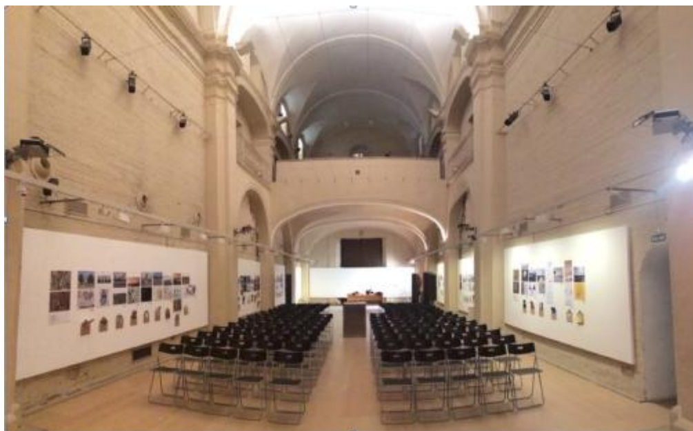
Fig. 3 Exposición de trabajos docentes en la I Jornada sobre Ciudades Interrumpidas. La Obsolescencia Instantánea de la Periferia . Convento Santa María de los Reyes, Consejería de Fomento y Vivienda de la Junta de Andalucía, Sevilla.

Durante tres cursos académicos, en el periodo 2014-2017, docentes vinculados a éste laboratorio han planteado una actividad práctica complementaria en HTCA4. “Ciudad As Found” fue la primera práctica que planteaba el estudio de territorios urbanos inmaduros localizados en la periferia sevillana cuyo desarrollo había sido interrumpido por la crisis económica, y buscaba para ellas estrategias de regeneración urbana creativa. Los resultados de esta actividad (paneles de análisis, panfletos-propuesta, y video creaciones) conformaron una exposición en el emblemático espacio del Convento Santa María de los Reyes, perteneciente a la Consejería de Fomento y Vivienda de la Junta de Andalucía, y sirvieron como escenografía de la I Jornada sobre Ciudades Interrumpidas. La Obsolescencia Instantánea de la Periferia organizada por miembros del grupo de investigación. Los estudiantes de los trabajos seleccionados intervinieron en la Jornada en una sección propia donde presentaban en formato de comunicación sus proyectos de investigación y propuesta.