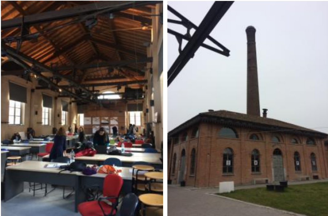
Fig. 6 Aula del Politecnico di Milano, sede de Piacenza, donde se impartió el curso.