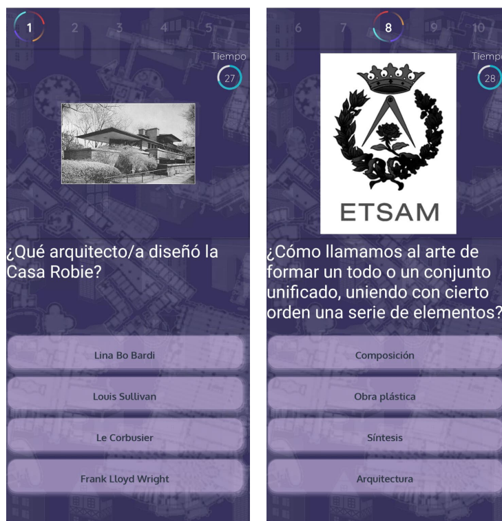
Fig. 4 Pregunta tipo con imagen (izquierda) y pregunta tipo sin imagen (derecha).

Definir el tipo de preguntas a incluir ha supuesto un reto para el equipo de investigación. Las opciones disponibles se han mostrado muy variadas, desde las preguntas básicas tipo cuestionario (finalmente elegidas) hasta las preguntas tipo memory ; pasando por preguntas con múltiples respuestas o de emparejamiento. Fig. 4.