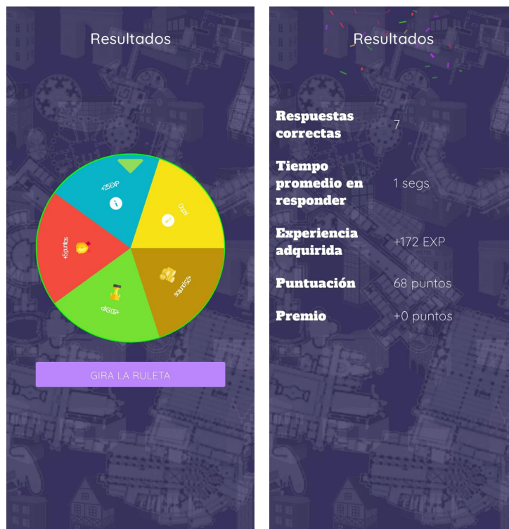
Fig. 3 Pantalla de generación de resultados tras la partida (izquierda) y pantalla de puntuación posterior (derecha).

En las partidas de 20 o 40 preguntas, el reto fundamental es escalar posiciones en la clasificación general para que el/la jugador/a tenga la referencia de su progresión entre el conjunto de usuarios/as. De este modo, aunque aún no se ha incluido en la aplicación la posibilidad de retos directos a otros/as jugadores/as, el reto personal será estar entre los primeros puestos de la clasificación. Dado que, como se ha mencionado, existe una clasificación temática de preguntas –cuyo detalle se comenta más abajo–, existe la posibilidad de clasificaciones específicas para cada bloque temático. Así, se cree que el incentivo para el uso de la aplicación ligada al aprendizaje será mayor, pues se estimula la consecución de puestos altos en la clasificación general, que atañe a las preguntas de todo tipo, pero también a la de las clasificaciones temáticas. Fig. 3.