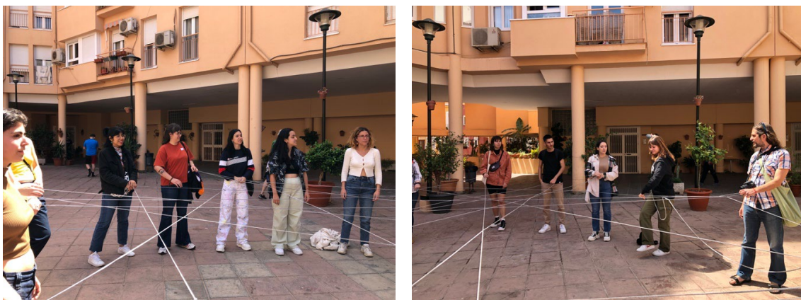
Fig. 2 y 3 Dinámica de grupo en el barrio dentro del Taller de mapeo colectivo (2023)

Esta experiencia surge con el propósito de revisar el territorio urbano y sus usos, para desarrollar estrategias creativas que pongan en valor el poder social de las minorías frente a los poderes hegemónicos. De acuerdo con el colectivo Iconoclasistas, el mapeo colectivo es una práctica de reflexión grupal que facilita el abordaje y la problematización de territorios sociales, subjetivos y geográficos; permite cruzar perspectivas desde distintos ámbitos de conocimiento y, así, elaborar relatos colectivos que nos permitan comprender y señalar diversos aspectos de la realidad (Risler y Ares, 2013). En este proceso el mapa es sólo una herramienta que facilita la realización de diagnósticos territoriales en un espacio horizontal que permite compartir saberes y tramar solidaridades y afinidades. Las diversas acciones se articularon en un proceso cooperativo favoreciendo el pensamiento colectivo y potenciando una mirada comunitaria y transformadora.