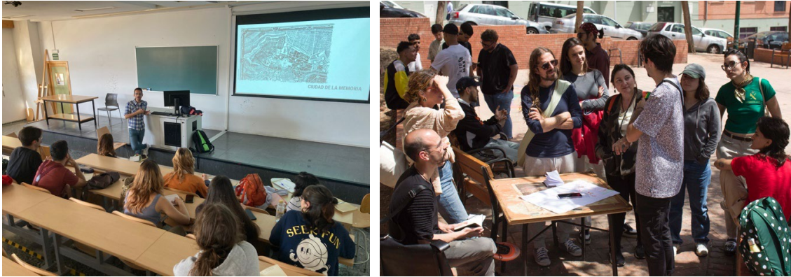
Fig. 4 y 5 Taller mapeo colectivo. En la universidad y junto a vecinos del barrio Cruz Verde-Lagunillas de Málaga (2023)

contexto de enseñanza-aprendizaje, en este caso, centradas en el trabajo de las personas que realizan la investigación, ya sea artística o educativa, enfocando su análisis sobre los procesos y productos. Dentro de esta tipología puede incluirse la a/r/tografía cuya naturaleza puede vincularse con la investigación-acción (López Melero, Soler García y Mancilla, 2013). Existe una estrecha relación entre estas metodologías y la investigación basada en la práctica o PBR ( practice-based research ).