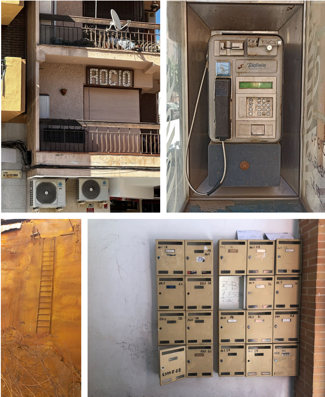
Fig. 13, 14, 15 y 16 Fotografías de los espacios escogidos por las participantes en Cruz Verde-Lagunillas, Málaga (2023)

A continuación, completó su trabajo traduciendo la acción física a lenguaje sonoro mediante el programa de edición de sonido Ableton Live . Otra de las participantes realizaría una performance retransmitida en directo desde sus perfiles en redes sociales. Mediante un guiño a una de las obras más icónicas del arte contemporáneo, la acción viene a señalar diferentes aspectos de género y socioculturales, con el connatural acto de orinar en un wáter abandonado entre los contenedores de basura en una de las calles principales del barrio.