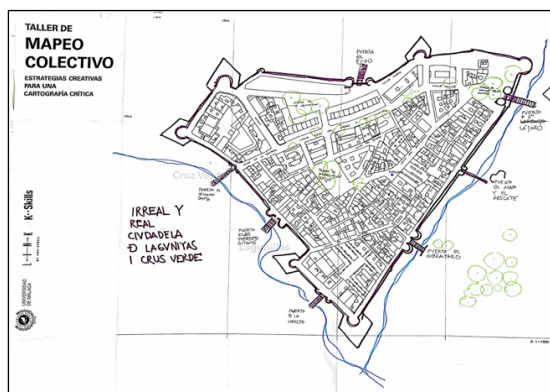
Fig. 8 Taller de mapeo colectivo en Facultad de Bellas Artes de la Universidad de Málaga (2023)