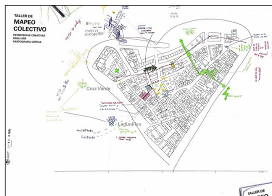
Fig. 9, 10 Mapas intervenidos durante el taller de mapeo colectivo, Málaga (2023)