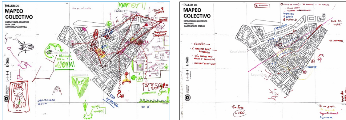
Fig. 11 y 12 Mapas intervenidos durante el taller de mapeo colectivo, Málaga (2023)