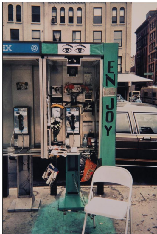
Fig. 6 Gotham Handbook . Fuente: Sophie Calle (1994) https://www.centrepompidou.fr/es/ressources/oeuvre/cGEa4yp

La experiencia de apropiación de un espacio público que la artista describe en Gotham Handbook constituye un ejemplo de su manera de describir la realidad de la ciudad, en este caso, Nueva York. El escritor Paul Auster invitó a Calle a establecer un fuerte vínculo con un lugar concreto dentro del entorno urbano, no sólo con el espacio físico, sino, sobre todo, con los usuarios del mismo, con sus usos y costumbres, para llegar a formar parte de la ciudad. Los acontecimientos que se fueron sucediendo quedaron registrados en un legado que narra, mediante un ejercicio de cartografía emocional, la pulsión de la ciudad en su lugar de máxima expresión: el espacio público (López, 2013). Esta experiencia sirve de inspiración en la propuesta del taller, invitando a que el alumnado desarrolle su cartografía de la ciudad a partir de la experimentación vivencial de la misma, apropiándose de un rincón del barrio, viviéndolo como suyo y describiendo mediante la realización de sus propios medios de expresión la realidad física, social o emocional de dicho espacio.