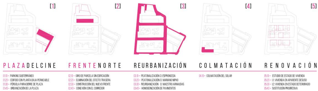
Fig. 1 Organigrama de actuación en el barrio de San José, Zaragoza. Autores: David Marco, Adrián Peiró (2017)

El análisis comparado de esos debates y experiencias internacionales y la contraposición con el caso zaragozano permitió en el taller de urbanismo llevar a la práctica una serie de presupuestos y estrategias que, de un modo u otro, han caracterizado el devenir de su centro histórico y de sus periferias interiores. 6 El objetivo, tal y como muestra la pequeña muestra de imágenes seleccionadas, fue realizar exploraciones sobre situaciones concretas en las que es posible y deseable plantear intervenciones específicas en el barrio y en determinados sectores urbanos (manzana, edificios, espacios públicos, colectivos y privados), partiendo de una inmersión previa de carácter teórico en los debates y casos de estudio relacionados con las cuestiones afrontadas, con perspectiva histórica internacional.