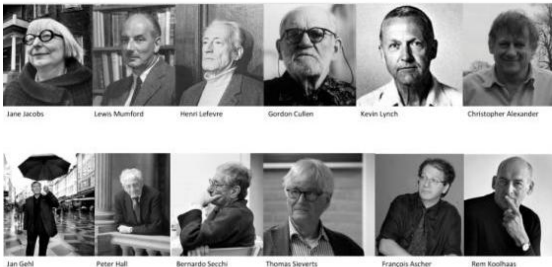
Fig. 4 Preguntando a los autores...

Con estas ideas de fondo, en las sucesivas ediciones de este Máster dedicado a la regeneración urbana la estrategia ha sido seleccionar una serie de temas y abordarlos a partir de otros tantos textos de autores de referencia, a tener en cuenta si se pretende poner en práctica un urbanismo culto y actualizado. Esta selección de autores y textos clave, adaptada a la duración y ritmo temporal del Máster, abarca desde los ya clásicos como Lewis Mumford, Jane Jacobs, Kevin Lynch, Gordon Cullen, Christopher Alexander o Henri Lefebvre, a otros más recientes como Peter Hall, Bernardo Secchi, Thomas Sieverts, François Ascher, Jan Gehl o Rem Koolhaas. Leyendo con atención esos textos de teóricos y profesionales que han reflexionado sobre el urbanismo, la ciudad o el paisaje durante los últimos cincuenta años, podemos entender mejor por qué determinados temas resultan recurrentes y, a la vez, novedosos, sobre todo cuando se confrontan con algunas aproximaciones poco fundamentadas o excesivamente ‘periodísticas’.