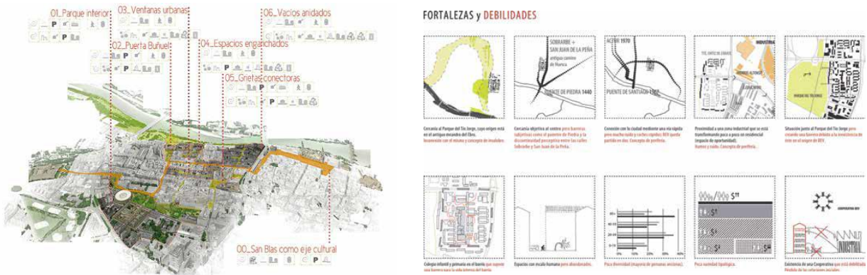
Fig. 2 Integrar, cohesionar, recauificar San Pablo. Autores: Ezquerria Alcázar, García Yagüe, Lezcano Maestre, (2014)