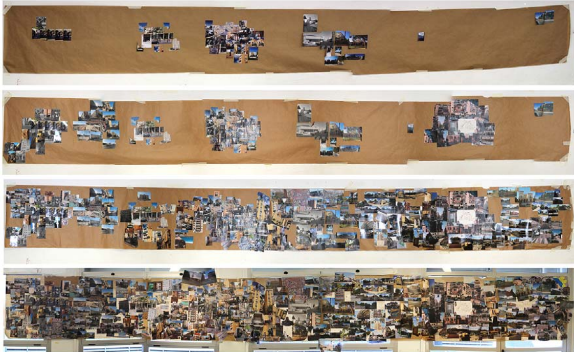
Fig. 2 Proceso de intervención en el collage realizado por los estudiantes de Composición Arquitectónica 1. Autores: Estudiantes de Composición Arquitectónica 1

numerosos momentos en los que la percepción del lugar adquiere un significado preferente. Desde el inicio, imágenes irán invadiendo el collage 6 e irán adquiriendo movimiento; trabándose unas, tapándose otras, rellenando el fondo de papel continuo (Fig. 2). Desde la independencia de una fotografía aislada o a partir de un conjunto de imágenes, se observan distintas maneras de expresión que colonizan el formato: con una actitud sigilosa, imágenes van ocupando rincones del soporte, caracterizando un modo introvertido de articular la visita; otras, más explícitas y expuestas, invitan al resto a conformar el collage.