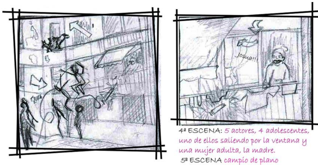
Fig. 6 Fragmentos del storyboard en Composición Arquitectónica 4 . Autora: Laura Pérez Navarro