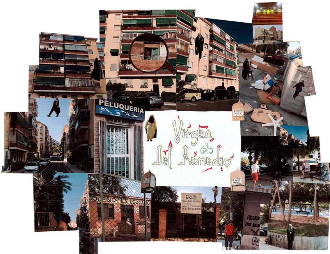
Fig. 3 Fragmentos del collage en Composición Arquitectónica 1. Autoras: Nada Aouni, Roa Hasnaoui y Salma el Hiri

En uno de los fragmentos del collage (Fig. 3), uno de los temas que puede interpretarse es el referido a la mujer marroquí. Los edificios del barrio Virgen del Remedio, presentados desde distintos puntos de vista, muestran su homogeneidad que se relaciona con la presencia de la mujer sobre las fachadas: aparece volando delante de los edificios, ocupa la calle ubicándola entre lo público y lo privado, el perfil de los cuerpos tapados mediante el hiyab es recortado para distinguirla . La mujer adquiere una presencia significativa. Cuando este grupo explica a los estudiantes de cuarto el papel de la mujer, habla de las dificultades de las mujeres musulmanas, de sus modos de vida, y de tradiciones como la fiesta del Ald-el Kabir . Las tres integrantes de esta parte del collage son marroquíes, y aunque conocen una misma cultura, sus modos de concebir la ciudad son distintos, aunque en su exposición reivindiquen el papel de la mujer musulmana.