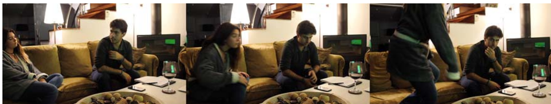
Fig. 7 Fotogramas del cortometraje Asesinato en ciudad Jardín en Composición Arquitectónica 1 . Autores: María Martínez Heredia, Federico Quiles García, Gonzalo Carrillo Mollá, y José Pablo Del Rincón Montes

Una tercera línea se acerca a los interiores del espacio privado. Aunque en el collage la presencia de interiores es mínima —ocasionalmente se muestran fragmentos del interior de una mezquita y de una vivienda—, los guiones o storyboards , y los cortometrajes, transmiten la curiosidad por traspasar los límites de los edificios. En el cortometraje Asesinato en Ciudad Jardín (Fig. 7) se describe el interior de la casa de un policía mostrando un modo de habitar que contrasta con la realidad del resto de barrios.