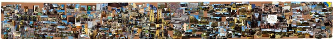
Fig. 1 Collage del ejercicio 1 en Composición Arquitectónica 1 . Autores: Estudiantes de Composición Arquitectónica 1

La imagen del collage realizado por los estudiantes de primero para el primer ejercicio (Fig. 1), es la de la cotidianidad de numerosas realidades de los barrios seleccionados: ropa tendida en la fachada, pintadas en paredes, una persona con bolsas llevando la compra, niños jugando entre los árboles de un parque, un coche circulando por una calle vacía... ; cada una de ellas presenta múltiples acontecimientos de la gente que habita la ciudad. El segundo día de clase, los integrantes del curso se dispersaban en una deriva que los llevaba a descubrir calles y plazas que muchos desconocían 5 , tomando imágenes que configurarían el collage, entrelazando