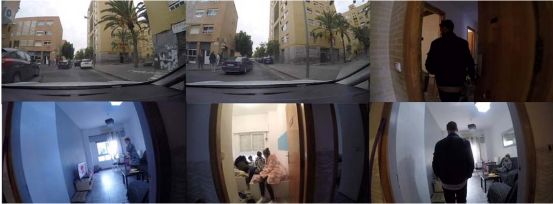
Fig. 8 Fotogramas del cortometraje Sin título Composición Arquitectónica 4. Autores: María Garrido Riera y Darío Vilana Palomino

cruda de los barrios presentada en su espacio público y generada en el interior de algunos espacios privados. El acontecimiento de meterse en la casa de una familia, se acerca a mostrar cotidianidades que forman parte de una realidad violenta y ajena, que, a su vez, son causa de contrariedades económicas y sociales que sobrellevan los vecinos del barrio. De esta manera, el cortometraje, establece otros vínculos, difíciles de detectar únicamente desde el espacio público.