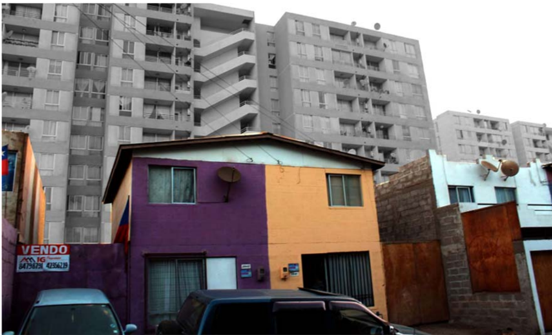
Fig. 1 Gentrificación y Mercado Inmobiliario.

La Toma Génesis, conocida como villa Noruega, debido a la procedencia de las viviendas que se les entregaron en el 1992, junto con Las Urbinas, fueron las fundadoras de la ciudad, y en su relación constante con los lugares de obtención de recursos (agua y alimento) determinaron una estructura proto-urbana que en un principio se asocia a la Iglesia "Nuestra Señora de la Paz", lugar dónde recibían agua y algunos víveres. La panadería Kongi, era el único almacén donde se podían comprar alimentos, además del lugar donde se instala "el Pílon" de agua, que posteriormente configuraría las tuberías que abastecían la toma, construida por las mujeres del Campamento que jugaron un rol fundamental en este periodo.