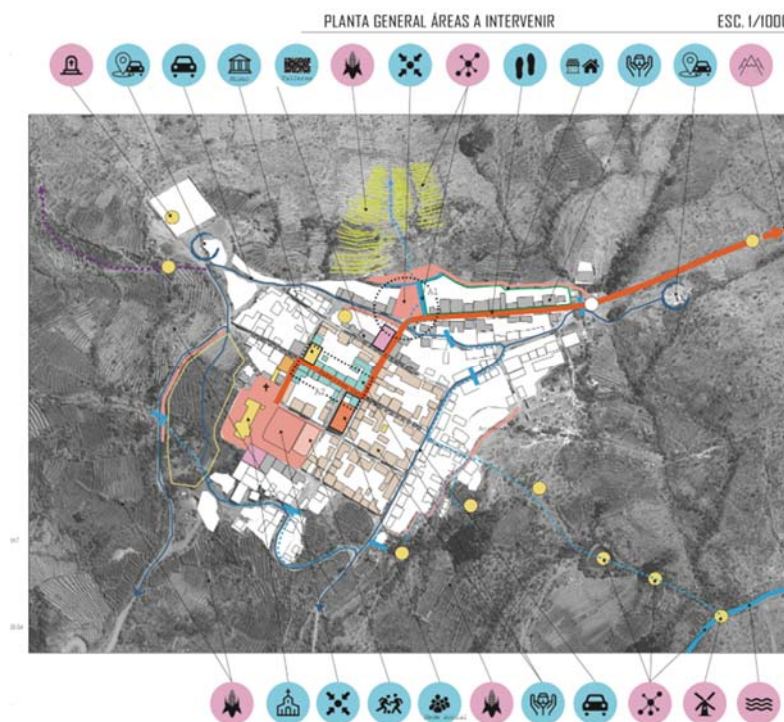
Fig. 3 Plan Urbano Estratégico: Consolidación de los Espacios Simbólicos del Poblado Andino de Chiapa.

Entre velas, cirios, cintas y coronas de flores acompañado de canticos al ritmo de las comparsas, se parte en procesión por las principales callecitas del pueblo muy bien decoradas con guirnaldas y flores hechas para la ocasión, se recorren así las 4 esquinas la primera que da a la plaza, una segunda esquina, la sede social y una última cuarta esquina que se abre hasta llegar a las puertas de la iglesia donde nos espera el padre Pablo para dar comienzo a la misa de vísperas.