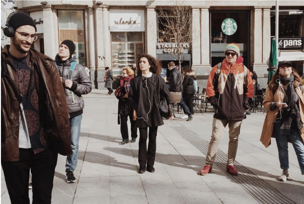
Fig. 5 Alumnos en el paseo aural en Gran Vía.

Se plantearon dos paseos por la Gran Vía. En el primero se les aportó una serie de preguntas para que reflexionasen sobre el siguiente ejercicio: el lugar o escenario en el que se desarrollaría la acción.