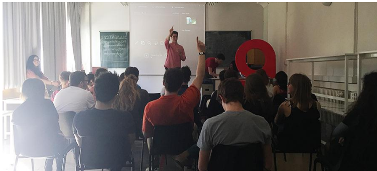
Fig. 3 Clase teórica en el curso Héroes y Villanos . Fotografía de las autoras (2018)