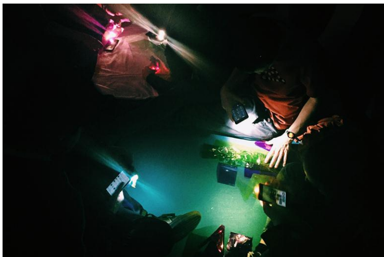
Fig. 4 Alumnos trabajando en el taller de iluminación. Fotografía de las autoras (2018)

Se organizó un taller de iluminación para aportar nociones básicas de la importancia de luz en piezas audiovisuales. Por otro lado, y enfocado a las presentaciones finales, se dió un taller de herramientas para hablar en público.