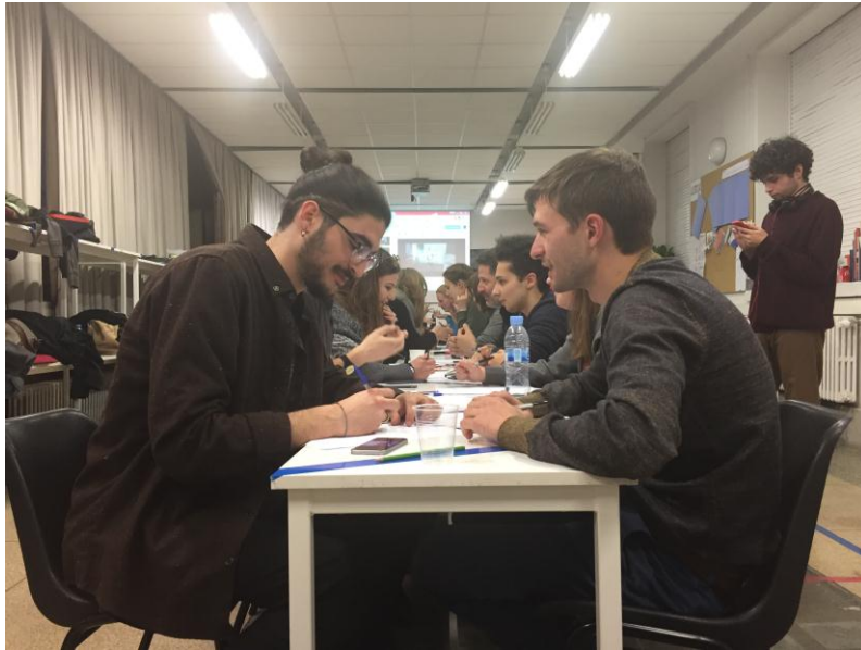
Fig. 6 Varios alumnos trabajando simultáneamente en la aplicación Realtimeboard.