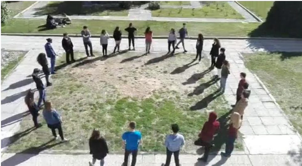
Fig. 8 Sesión de juego dramático en el jardín de la ETSAM.

El curso se desarrolló fundamentalmente en el aula destinada a los alumnos del MACA, el aula XG5 de la ETSAM. Es una aula taller que admite distintas disposiciones en función de las necesidades. El espacio, con acceso directo al jardín de la escuela, permitió realizar algunos de los ejercicios en el exterior.