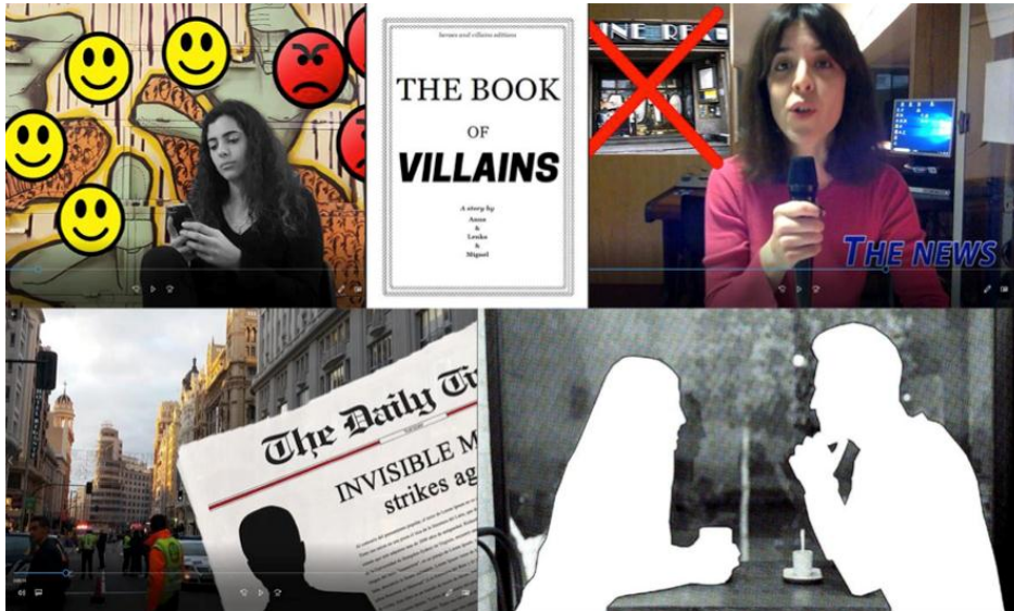
Fig.10 Algunos de los resultados del curso ATHENS "Héroes y Villanos". Elaboración alumnos ATHENS (17-18)

La autoexploración previa permitió también que cada alumno encontrase el lugar donde sentirse más creativo. Se identificó que, pese a lo limitado de los tiempos, se trabajó de manera fluida, con un liderazgo equilibrado en los equipos.