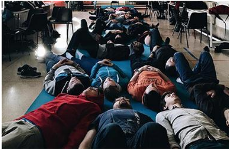
Fig. 2 Imagen de la primera sesión de juego dramático.