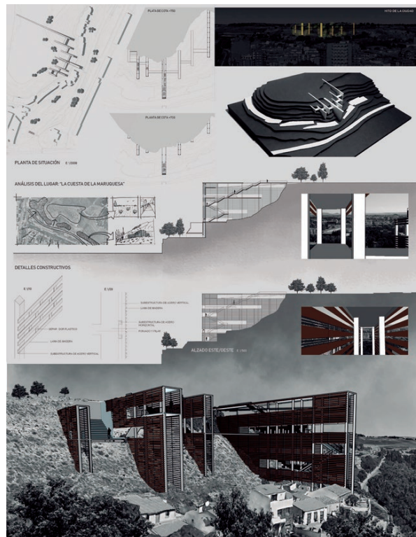
Fig. 4 Equipamiento socio cultural y articulación del recorrido de ascenso. P. II Semestre 1