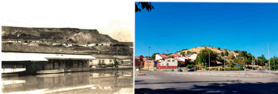
Fig. 2 Dos vistas del emplazamiento, antigua y actual; desde la dársena del canal y desde el encuentro de carreteras

- Articular el aprendizaje de modo individual y de forma colectiva (Pérez, Villalobos, López, 2019), identificando tareas en cada uno de esos modos de trabajo diferentes contribuye a activar el aprendizaje dentro y fuera del aula en una línea coherente que ayude a discernir la adquisición de conocimientos fuera del aula en la mejor eficacia para su progreso en la asignatura. Se trata de convertir al alumno en protagonista de su propio aprendizaje (Rizzo et al, 2015). La facilidad con la que se puede acceder a cualquier fuente de conocimiento en todo el mundo a través de internet hace que esta metodología sea más necesaria.