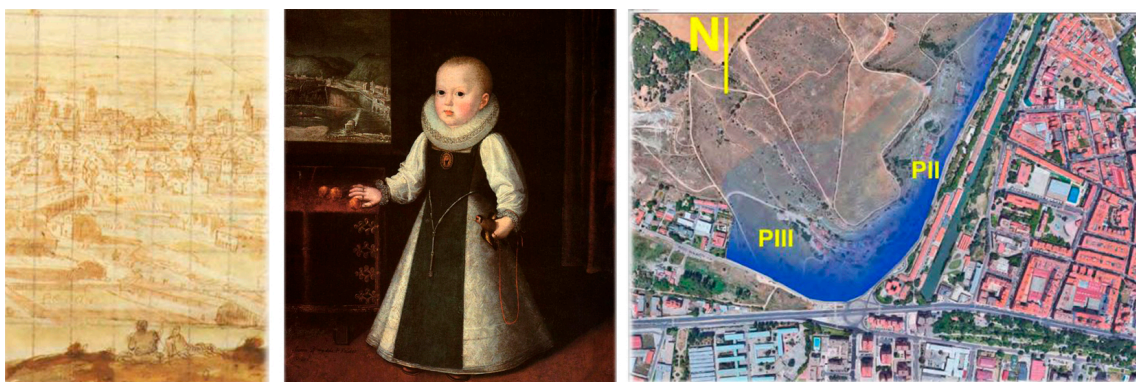
Fig. 1 A). Grabado, fragmento: dos personajes subido en La cuesta de la Maruquesa contemplan la ciudad. B). Vista del lugar de trabajo a través de la ventana de la infanta. C). Plano de situación con la localización de cada semestre

Es un primer e importante paso para transferir al estudiante la importancia de su propia responsabilidad sobre el proyecto, para que sea capaz de trascender la habitual condición de mera práctica escolar en la Escuela. Sus proyectos son ya verdaderas acciones para transformar la realidad, y, en consecuencia, la experiencia de proyectar no es una simulación, sino que forma parte de su experiencia vital. El deseo de transformar la realidad (Piñón, 2006) en todo proyecto surge, en este caso, del encuentro dialéctico con un barrio concreto de la ciudad.