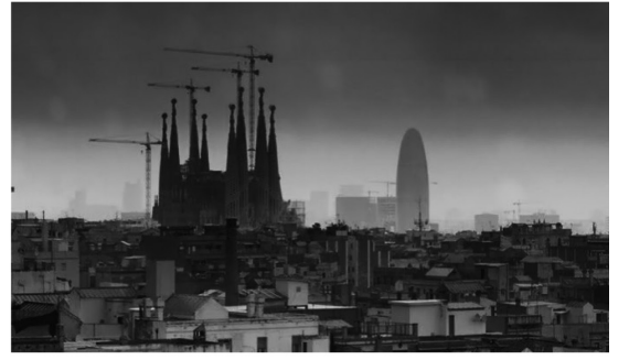
A BIUTIFUL. La Sagrada Familia en el hospital