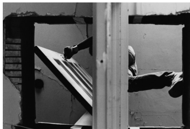
Bronx Floors: Threshole, 1972. Gordon Matta-Clark