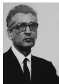
Casa Uriach 1961 José Antonio Coderch

Como última ventana, ofrecemos la que José Antonio Coderch de Sentmenat realiza para la Casa Uriach en 1961 en l'Ametlla del Vallés a semejanza de las utilizadas en otras casas como la Rozes en Roses, ... Coderch utiliza una ventana tradicional vertical colocada en la esquina de la habitación, a la que le otorga posibilidades de ventilación superior, puerta de acceso al exterior, vista, provista de una persiana que desliza sobre una guía. Esta decisión le permite, en apenas 4m de fachada, colocar 4 dormitorios escalonándolos, contribuyendo a la creación de una tipología personal.