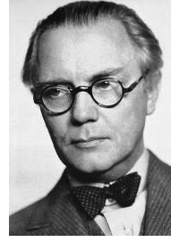
Biblioteca de Estocolmo 1924-28 Erik Gunnar Asplund

Erick Gunnar Asplund, en la Biblioteca de Estocolmo en los años 1924-28, abre ventanas rasgadas en la parte superior del gran cilindro, que contiene la sala de la biblioteca, potenciando una iluminación uniforme y atendiendo a la cualidad de la luz septentrional de incidencia casi horizontal propia de esa latitud. De noche, iluminado, el cilindro que remata la biblioteca se nos manifiesta como un faro urbano de luz artificial.