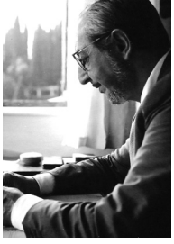
Gipsoteca Canoviana 1955-57 Carlo Scarpa

Carlo Scarpa, en la Gipsoteca Canoviana de Possagno (Provincia de Treviso) en los años 55-57, recurre a una ventana de esquina en el encuentro de los dos muros que adopta forma tridimensional en lo que podríamos denominar ventana-lucernario. De esta forma, la luz casi cenital sin sombras ilumina uniformemente los planos de la estancia no dejando paredes en sombra y bañando las esculturas. Como decía Carlo Scarpa "volevo ritagliare l'azzurro del cielo".