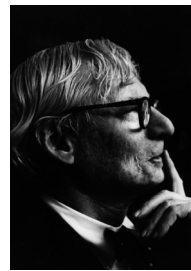
Esherick House 1959-61 Louis I. Kahn

Louis I. Kahn, en la Casa Esherick en Chestnut Hill en los años 1959-61, de forma semejante a las ventanas realizadas en el Tribune Review (1958-61), crea una ventana compuesta de una fisura vertical y una gran abertura horizontal en la parte superior. De esta forma, la ventana superior aporta una gran cantidad de luz uniforme, iluminando los paramentos de la estancia y cortando el reflejo. La fisura vertical permite el contacto visual con el exterior incorporando su entorno, construyendo con mobiliario el hueco.