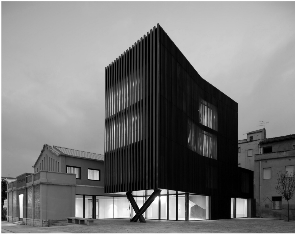
Josep Camps i Olga Felip Centre Cívic Ferreries, Tortosa ▲

Des de l'interior, comencem treballant el programa, buscant una lògica o estructura interna. Aquí a Catalunya, és habitual que els arquitectes no estiguem especialitzats en cap tipologia específica, però cada tipologia té requeriments funcionals molt