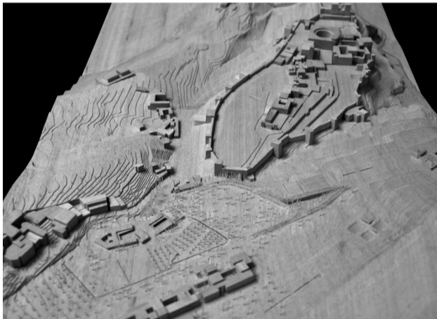
Maqueta de Implantación del Atrio de la Alhambra junto a edificaciones existentes