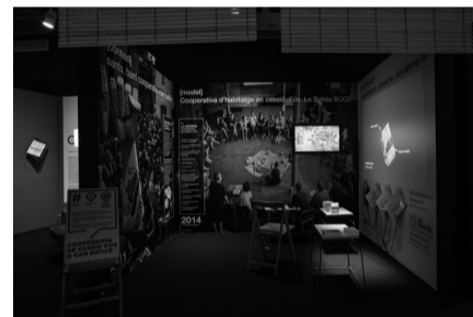
▲ SUP. Ressò . CEN. Masoveria Urbana INF. Can Batlló .

Es tracta d'una cooperativa en règim de cessió d'ús inspirada en els models cooperatius Andel - que funcionen des de fa temps i de manera molt consolidada a Dinamarca, entre d'altres llocs. En una cessió d'ús, la propietat de l'habitatge sempre resideix en la cooperativa i mai en els que hi viuen -els i les sòcies habitants- a títol individual. D'altra banda, la presa de decisions, sobre tot pel que afecta al dia a dia com les formes de convivència, les qüestions energètiques, o l'arquitectura dels espais comuns, es produeix en l'assemblea general, el seu principal òrgan decisor.