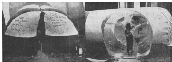
Acceso a la Ciudad Instantánea ideado por los estudiantes del modo más económico y siempre con una absoluta realización manual

F. Bendito, C. Ferrater, J.M. de Prada Poole