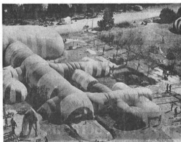
Vista general en proceso de construcción de la red de hinchables

Para una vez dentro la generación del espacio escapa a la habitual percepción y los sentidos se ven atraídos, la sobrepresión, principalmente, crea un determinado desconcierto mágico que se convierte en admiración de lo evidente. La ciudad instantánea es la primera experiencia nacional en la que se ha intentado plantear la construcción como experiencia expresiva de las relaciones humanas. Queda de ella unos miles de metros cuadrados construidos, el casco del proyecto que se ha planteado esperando una alternativa de uso ecológico, una serie de relaciones personales al calor del trabajo como vehículo de comunicación y la clara conciencia del momento histórico en que vivimos. El resto es el tiempo poco importa, lo esencial es el comienzo. Durante el Congreso la ciudad instantánea se convirtió en plataforma publicitaria, miles de fotos, grabados y vídeos de películas del espacio construido adquiere un significado escultórico formal. Queda, sin embargo, como un territorio a los residentes y temas de conversación para los congresistas al momento de su reunión, así como la construcción de un espacio futuro.