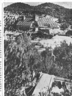
En primer término los hinchables de la Ciudad Instantánea, al fondo los hoteles. Obra del arquitecto Ramon Torres