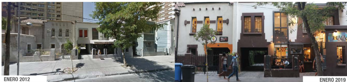
Fotografía N°6: Bar Restaurante, Argomedo.