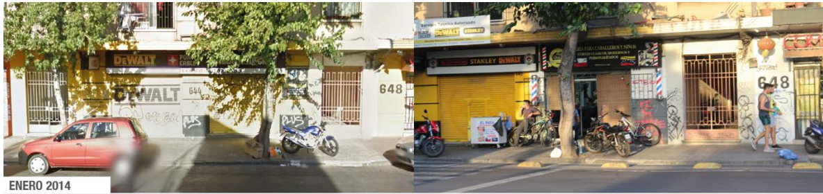
Fotografía 2: Barbería venezolana, Portugal.

Supermercados de barrios: si bien es el de mayor escala y, por ende, el más intrusivo para el contexto barrial, este tipo de comercio mantiene códigos conocidos y aunque representa una amenaza para la forma en que tradicionalmente se concibe la relación cliente-locatario en un barrio, este formato colabora en la economía doméstica, debido a sus menores precios relativos: