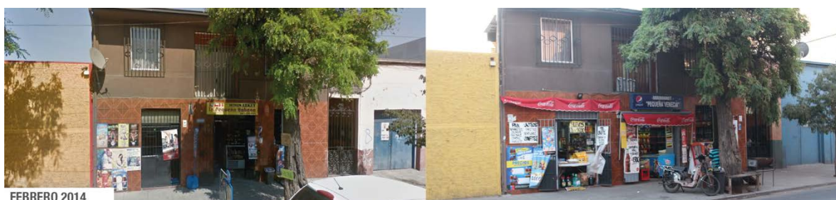
Fotografía 1: Minimarket, Fray Camilo Henríquez. 5

Comercio de menor escala: se trata del tipo de comercio que más se ha multiplicado en el barrio. Sus principales estrategias son el aumento de la variedad de su oferta, principalmente la de productos vinculados con la migración latinoamericana que se ha asentado en el barrio: harina para arepas, distintos tipos de empanadas, chicha venezolana, plátanos verdes, entre otros.