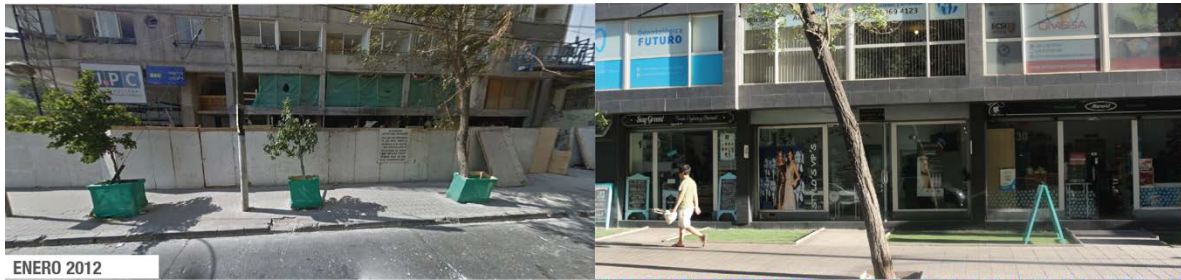
Fotografía 5: Placa comercial, Argomedo.