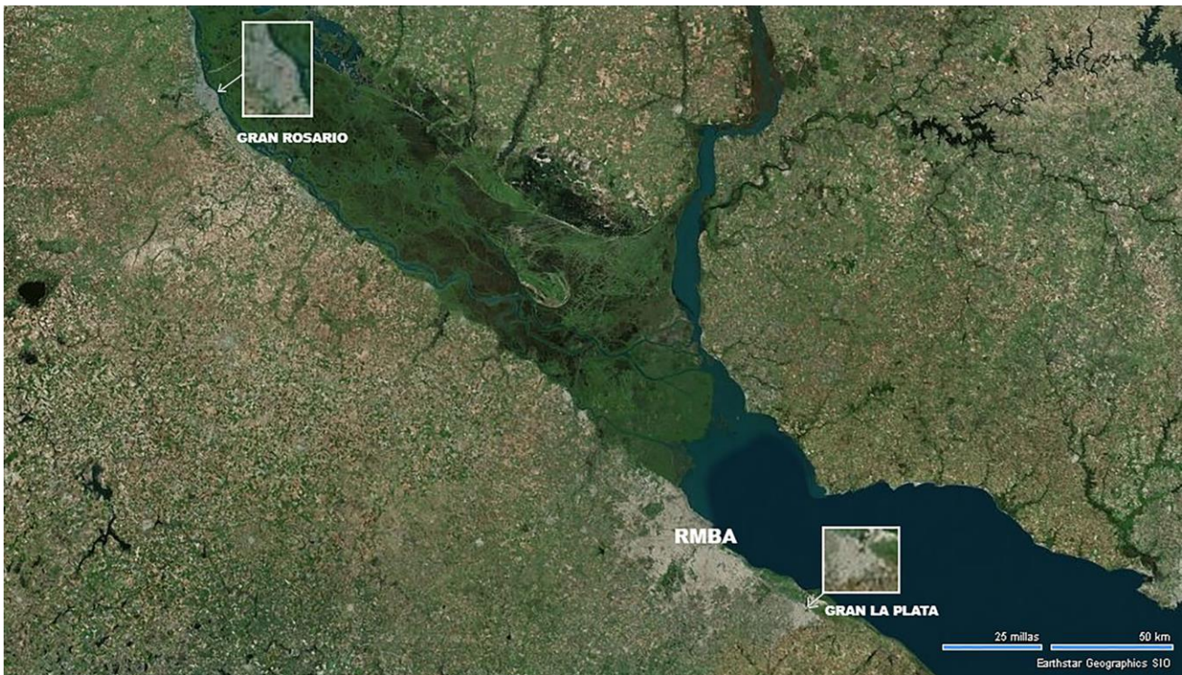
Figura 1. Mega-región Buenos Aires-Rosario.

Las características de este modelo de expansión de la urbanización pueden definirse de la siguiente manera: