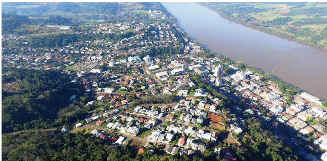
Fig 07. Vista aérea da área urbana do município de Itapiranga às margens do Rio Uruguai.

Assim, em 2017, um estudo socioambiental buscou analisar a situação das APPs dentro do perímetro urbano do município de Itapiranga, mapeando as áreas que poderiam ser consideradas de risco de escorregamentos, deslizamentos e inundações, e delimitando uma nova área de margem para preservação (Alto Uruguai, 2017). Como aspectos positivos, ressalta-se o fato de que a restrição de ocupação de parte dos morros do município, em virtude da declividade dos lotes, pode funcionar como uma medida que possibilite a manutenção das características originais do sítio formador de Itapiranga, preservando seus morros e a vegetação existente.