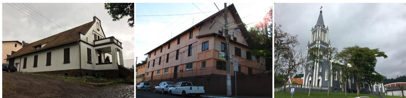
Fig 04. Em ordem, Casa Canônica, Associação Católica Kolping, Igreja Matriz São Pedro Canísio, em 2017.

Além disso, edificações importantes para a vida em comunidade, que compuseram o núcleo fundacional e ainda permanecem na paisagem urbana, foram construídas sob suas iniciativas, como a Casa Canônica, a Associação Católica Kolping e a Igreja Matriz São Pedro Canísio, observadas na Figura 04.