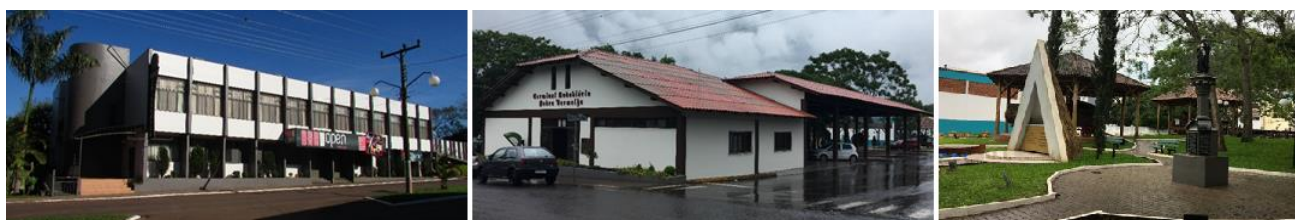
Fig 06. Clube Imigrantes, Terminal Rodoviário Pedra Vermelha e Praça dos Imigrantes, em 2017.

Além disso, ao longo dos anos, o perímetro urbano foi sendo alterado constantemente. Na malha urbana, as alterações corresponderam à inclusão de novas ruas no sistema viário e às obras de calçamento com pedras basálticas irregulares e, mais tarde, asfalto. Quanto aos espaços construídos na área urbana, destacam-se o Clube Imigrantes, o Terminal Rodoviário, a Praça dos Imigrantes, observados na Figura 06. Curiosamente, os terrenos da praça e do terminal correspondem ao local indicado como ponto de chegada dos primeiros imigrantes da então Colônia Porto Novo, onde a primeira missa teria sido celebrada.