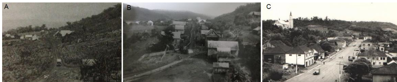
Fig 03. Núcleo urbano estruturado a partir de uma rua principal ao longo dos anos: A-1927, B-1935 e C-1970.

Considerando que a Stadtplatz tenha passado a servir como centro administrativo, comercial, escolar, religioso e social da colônia, a partir da análise das fotografias dos primeiros anos de colonização e desenvolvimento da colônia, compiladas na Figura 03, verificou-se que o elemento gerador da forma urbana foi uma rua, linear e paralela ao longo do rio – configurando uma Strassendorfen (Waibel, 1949; Roche, 1969) –, que ordenou o plano urbano, pois novas ruas eram abertas paralelas ou perpendiculares a ela.