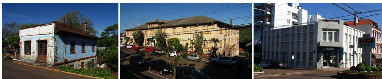
Fig 05. Em ordem, edificações da antiga sede da Prefeitura Municipal, do antigo Colégio São Vicente e da Caixa Rural União Popular (atual Sicoob), em 2017.

Neste período, o perímetro urbano foi ampliado a oeste do núcleo fundacional e houve o alargamento das ruas do Comércio e Uruguai, esta mais próxima ao rio. Como novos pontos de referência na paisagem urbana do período, destacam-se a antiga sede da Prefeitura Municipal, em estado de abandono, o antigo Colégio São Vicente e a Caixa Rural União Popular, atual Sicoob, edificações que podem ser observadas na Figura 05. É também desse período a aquisição de terrenos da Volkssverein para a construção de praças e parques a fim de criar espaços públicos para que a população pudesse desfrutar de momentos de lazer.