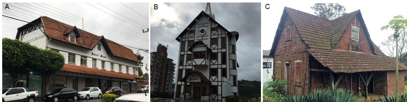
Fig 08. Edificações que simulam a técnica enxaimel (A e B) e verdadeira construção em enxaimel demolida em 2016 (C).

Ainda quanto aos aspectos culturais, destaca-se a realização da Oktoberfest , considerada a maior festa da cultura alemã, cujo primeiro evento deste tipo no Brasil foi realizado na comunidade de Linha Becker, em Itapiranga, em 1978. Em 1990, a festa foi oficializada e passou a ser realizada também no centro urbano. A cada ano que passa, adquire novas proporções, abrigando não apenas a comunidade itapiranguense, mas recebendo visitantes de todo estado, país e exterior (Sehnm, 2009).