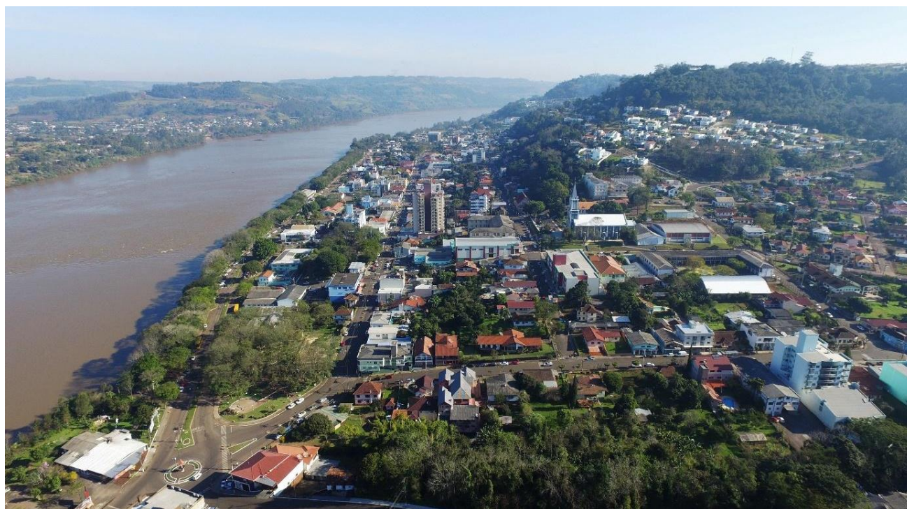
Fig 02. Vista aérea da área urbana do município de Itapiranga às margens do Rio Uruguai.

A forma urbana, como resultado de fatores sociais, econômicos, políticos e culturais, está relacionada com a apropriação do espaço e à vida em comunidade (Lamas, 2016). Considerando que o suporte geográfico é um dos elementos essenciais na determinação da forma urbana, no caso de Itapiranga, a paisagem e o espaço urbano são fortemente condicionados aos elementos naturais, como rios, arroios e morros, cobertos pela Mata Atlântica, os quais tiveram papéis determinantes na implantação da colônia. O núcleo urbano do município se encontra às margens do rio Uruguai, sendo que entre rio e montanha, o tecido urbano se desenvolveu linearmente, como verificado na Figura 02. 3