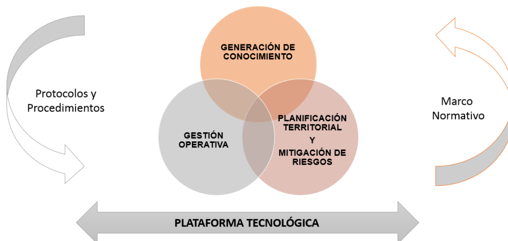
Fig. 01 Esquema general de la plataforma tecnológica. Elaboración propia.

Dentro de la estructura orgánica funcional de la plataforma se encontrará una directiva que es la encargará del monitoreo, generación de estrategias, políticas y administración de la plataforma; se contará también con un comité consultivo que aportará de forma externa con el conocimiento científico para generar información (este comité lo conformará la academia, científicos e investigadores); un área de gestión operativa que articulará las acciones de respuesta interinstitucional antes, durante y después de una emergencia o incidente; y, un área