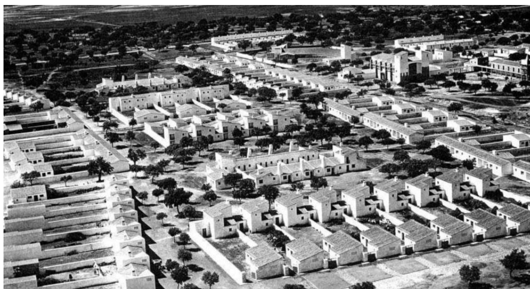
Fig. 01 Vista aérea de Vegaviana, 1959.

El Instituto Nacional de Colonización (INC) construye una serie de pueblos de colonización diseminados por todo el territorio español con el objetivo de apoyar las nuevas infraestructuras hídricas estructuradas para reformar el ámbito agrario hacia el regadío. Se construyen alrededor de 300 pueblos, y entre ellos se encuentra Vegaviana, proyectado por el arquitecto José Luis Fernández del Amo. Se trata de un pueblo de los años 50 del siglo pasado que se construye en Cáceres, concretamente en Sierra de Gata, ligado profundamente a su entorno. Y es que su diseño se configura para conservar el arbolado de la dehesa preexistente y establecer una relación directa con las viviendas, al mismo tiempo que forma parte de su construcción a través de materiales locales como la pizarra de la mampostería de los muros de fachada procedente de una cantera próxima, o el barro cocido de la localidad de los suelos (Fernández del Amo, 1954). Unas cuestiones, entre otras, que le convirtieron en icono de la arquitectura moderna española, y que, al mismo tiempo y desde nuestro punto de vista actual, relacionan al pueblo con la sostenibilidad.