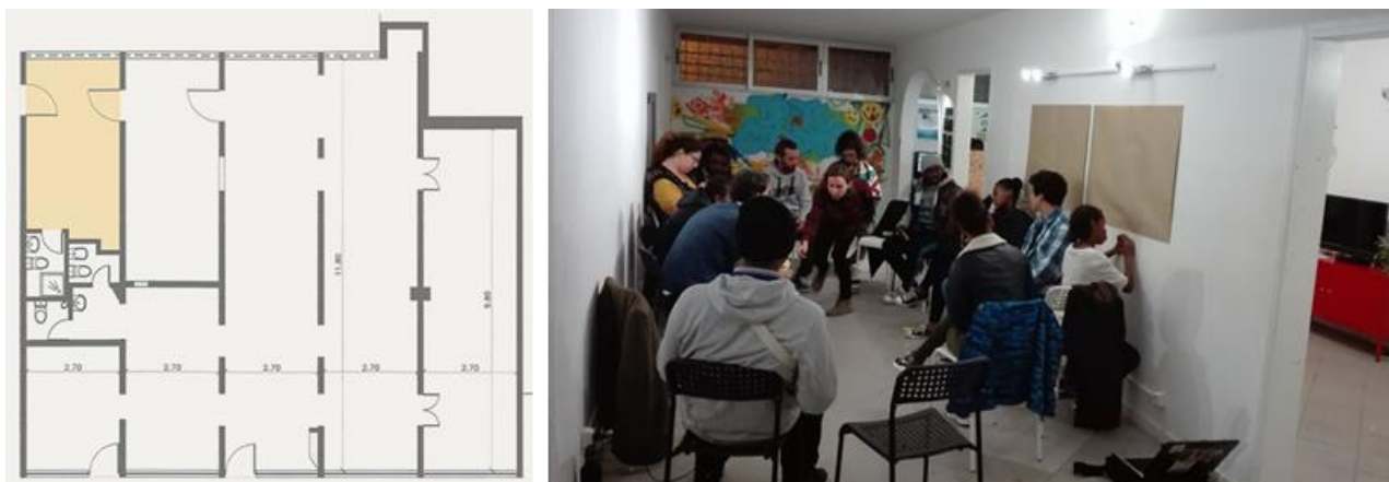
Fig. 4 Propostas de Reabilitação – Estúdio Comunitário. 2018. Rés do Chão.

Nesta perspectiva de uma prática-outra e projeto-outro, chama ainda atenção o discurso no website sobre a monitoração dos projetos. Se, por um lado, essa é uma imposição da maior parte dos órgãos de fomentos, por outro, poderia representar o entendimento do projeto como processo, como dado inacabado por ser dependente do desempenho social, exigindo assim revisões e ajustes contínuos, como na utopia experimental de Lefebvre (2001). Sinalizando que essa prática ainda não está sedimentada, mas ainda dependente de mais um financiamento , o grupo parece não ter maiores reflexões sobre o tema. Ilustra esse argumento o fato de terem migrado da Misericórdia para Marvila, “pelo desejo de aplicar a metodologia em áreas com problemas semelhantes”, em detrimento da necessidade de gestionar problemas decorrentes da transformação drástica sofrida pela Misericórdia nos últimos de cinco anos, quando passou a ser cool em Lisboa e os seus térreos, de desocupados a generosas fontes de renda. Resta saber quando darão por acabado os projetos – quando acabarem os financiamentos?