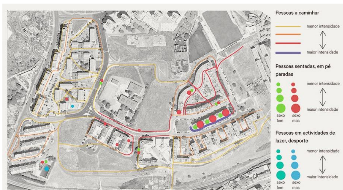
Fig. 1 Diagnóstico Marquês de Abrantes, Alfinetes e Salgadas. 2018. Rés do Chão.

participação em atividades de “auscultação” e de integração social, como assembleias e grupos comunitários. Atestam isso, os dados qualitativos expressos graficamente nos diagnósticos que desenvolvem em Marvila em 2018 9 (Fig 1) e o seu envolvimento com a comunidade, testemunhado no cotidiano do grupo junto à Biblioteca de Marvila. 10