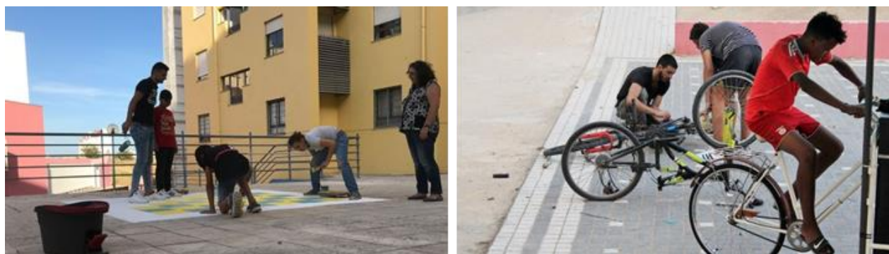
Fig. 2 Propostas de Dinamização – C-Bairrista e Cicloficina Crescente. 2018. Rés do Chão. Fonte: http://resdochao.org/projectos/

Ainda como propostas de ativação-dinamização , agorano âmbito dos pisos térreos, o grupo desenvolveu a Pop-Up Loja Convida (2018) que, com a participação voluntária de moradores, transformou uma sala desocupada em loja efêmera, onde foram desenvolvidas oficinas, workshops e reuniões comunitárias, durante o evento Os Dias de Marvila . A proposta foi inspirada em uma das experiências mais expressivas (ou mediáticas) do grupo na Misericórdia, onde, por iniciativa própria, alugou, reformou e promoveu a ocupação de uma loja abandonada, para ilustrar a potencialidade de modelos de arrendamento alternativos.