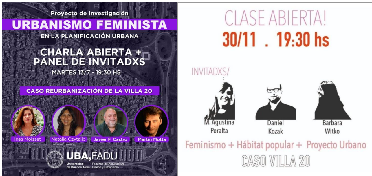
Fig. 05 y 06 Flyers Clases abiertas, elaboración Pasantía Urbanismo Feminista en la Planificación Urbana .

La experiencia permitió a su vez identificar articulaciones desde la gestión pública con diversos equipos técnicos, en una búsqueda incluso de realizar instancias de monitoreo y ajuste de sus propias prácticas (Observatorio Latinoamericano - OLA, Ministerio Público de la Defensa, Taller Libre de Proyecto Social - FADU, entre otros ejemplos) donde cada contraparte ha ido aportando desde su experticia con procesos, evaluaciones y monitoreos del proyecto de reurbanización. En este contexto, el aporte desde la universidad del equipo de Urbanismo Feminista devino en un enriquecedor intercambio que incluyó recorridos del barrio, entrevistas, exposición de los resultados obtenidos y charlas - debate que acercaron las visiones de la academia, la sociedad civil y las instituciones de gobierno.