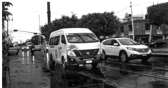
Fig. 5: Combi, transporte colectivo.

A su vez, los principales medios de transporte en este municipio son los autobuses urbanos y suburbanos, así como combis. También circula una línea 3 del Mexibús que va del municipio de Chimalhuacán hasta la alcaldía Venustiano Carranza, pasando por la parte centro de Nezahualcóyotl. También la línea B del Sistema de Transporte Colectivo Metro, tiene una estación en la parte norte del municipio.