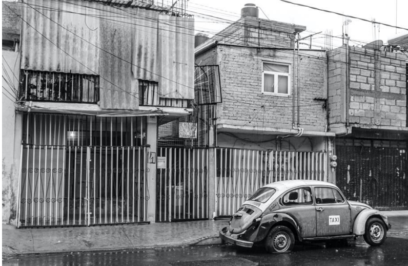
Fig. 2: Viviendas compartiendo terreno.

que en la mayoría de las viviendas hay entre 1 y 4 habitantes, además de que las viviendas comparten terreno con otras viviendas; así como servicio de agua potable, drenaje y disposición de residuos.