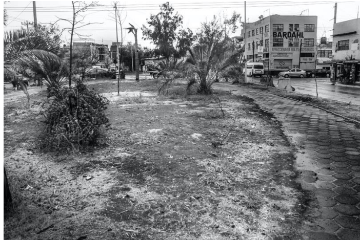
Fig. 4: Espacio público deteriorado.

Respecto al espacio público, se encuentra el siguiente equipamiento: 1 plaza cívica; 4 parques urbanos; 1 estadio; y 2 unidades deportivas. De igual forma dichos espacios se encuentran en malas condiciones, y son apropiados por el comercio informal, por lo que, durante el periodo de pandemia, fueron mayormente utilizados para este tipo de actividades.