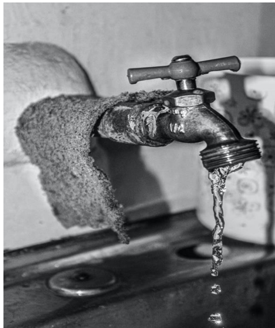
Fig. 3: Escasez de agua.

Al interior de las viviendas, el 99.6% tienen acceso a agua entubada, no obstante, de acuerdo con el Plan Municipal de Desarrollo Urbano de Nezahualcóyotl (PMDU 2005), la dotación de agua es de 155 litros por habitante al día, por debajo de la cantidad que se establece a nivel entidad que es de 200 litros de agua por habitante al día. Desde 2005 ya se reportaba un déficit en el abastecimiento de agua, si a esto le sumamos la presión demográfica y la demanda de agua por motivos sanitarios ante la pandemia, la escasez de agua en el municipio es evidente.