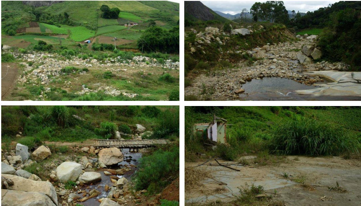
Figs. 5 a 8: Lavouras perdidas por conta da deposição de pedregulhos, Cascata (local do antigo campo de futebol), Rio Vieira e ruína de uma casa próxima ao Rio.