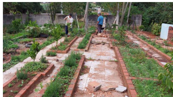
Figs. 1 a 4: Praça do Cruzeiro, Mirante de Vieira, Campo de Futebol e Horta Medicinal, respectivamente.