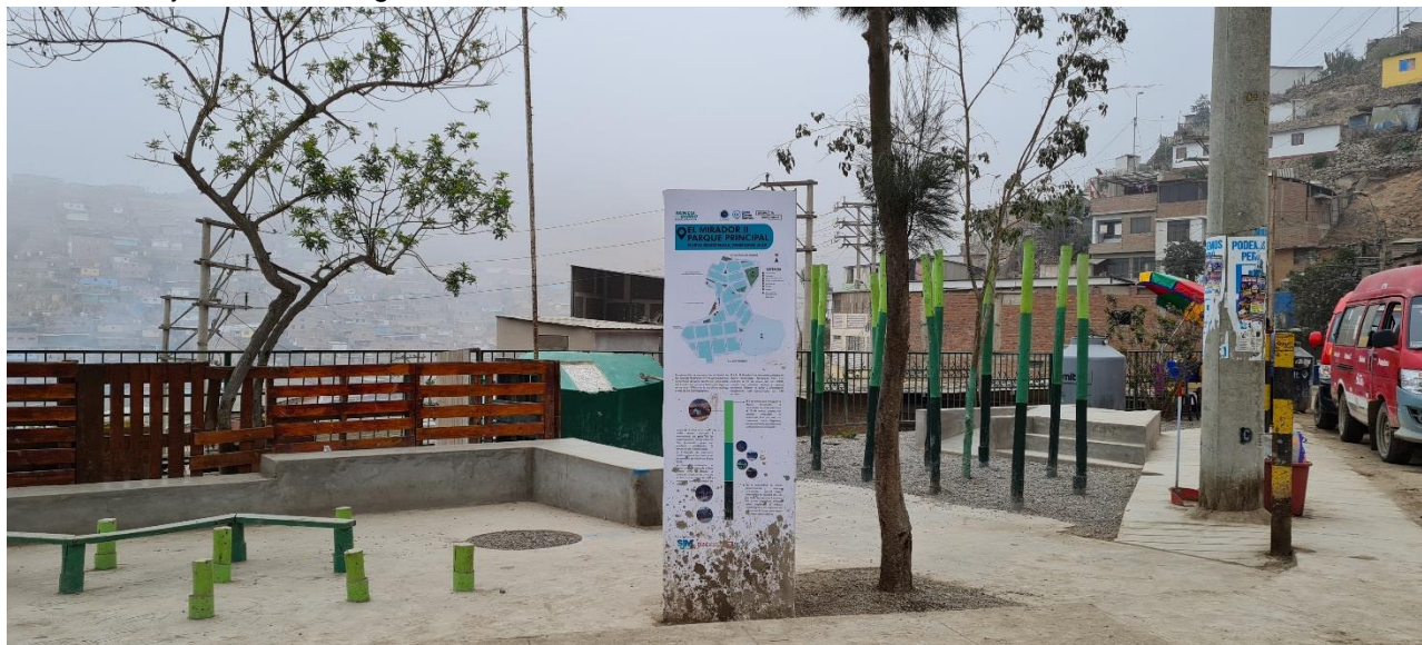
FIG. 7 Imagen de la zona 1 – área de descanso y espera del transporte público. Fuente: archivo propio. Material inédito de la investigación

El proyecto Reinicia tu Barrio Pamplona se realizó entre el año 2020 y el 2023 en el barrio Pamplona Alta – Mirador II en el distrito San Juan de Miraflores en la ciudad de Lima. El barrio se urbanizó en una zona de ladera al sureste de la ciudad, con una morfología urbana orgánica. Es una zona de crecimiento informal con altos índices de precariedad urbana, de carácter residencial con algunos comercios de escala barrial. El proyecto fue una “iniciativa de abastecimiento de servicios básicos y resiliencia urbana” 10 a través de la conformación de espacios públicos nodos comunitarios que buscan fortalecer los vínculos entre sus residentes. Se propone como una práctica de reactivación económica y social en el contexto post pandemia fortaleciendo las redes de solidaridad, ayuda y cuidado, además de un dinamismo de las economías locales. A través de metodologías participativas de ideación y co-creación se definen tres intervenciones en zonas que distan una de otra en no más de dos cuadras. En la zona 1 se construye un huerto urbano, en la zona 2 se conforma un espacio de juego para niños e intercambio ciudadano y en la zona 3 un espacio de descanso y espera (junto a la parada de transporte urbano) (ver fig. 7 y 8). De esta manera se abarcan las cuatro líneas de acción definidas de forma conjunta con las organizaciones sociales: recreación, educación, resiliencia e identidad cultural.