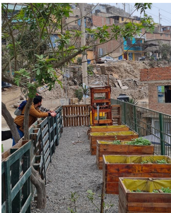
FIG. 8 Imagen del huerto comunitario. Material inédito de la investigación.

Según las mediciones de impacto del proyecto, se logró fortalecer la red vecinal del barrio a través del uso y gestión de estos espacio la cual se hace de forma colaborativa y organizada; se registraron nuevas actividades de uso de los espacios del tipo reunión social para celebración de fechas importantes; contribuyó a la seguridad y accesibilidad para niños, adultos y adultos mayores quienes usan los espacios para recrearse y socializar además de hacer de la actividad de espera del transporte público una acción más segura y cómoda; los vecinos adquirieron nuevos conocimientos y experiencia en procesos constructivos y de micro producción de alimentos. Según el colectivo, se pretende ampliar el proyecto a otras zonas del mismo barrio, implementando otras micro intervenciones que se sumarán a la red de microespacios urbanos en una lógica de máster plan de acupuntura urbana.