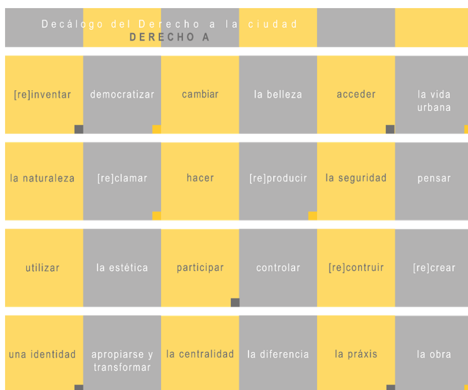
FIG. 1 Decálogo del derecho a la ciudad. Material inédito de la investigación.

En este ejercicio de moderación inductivo de diálogos urbanos entre estos autores, se construye el decálogo del derecho a la ciudad 1 (ver fig. 1), que contribuye a la síntesis parte de su trabajo y la apertura de nuevos debates e interpretaciones.