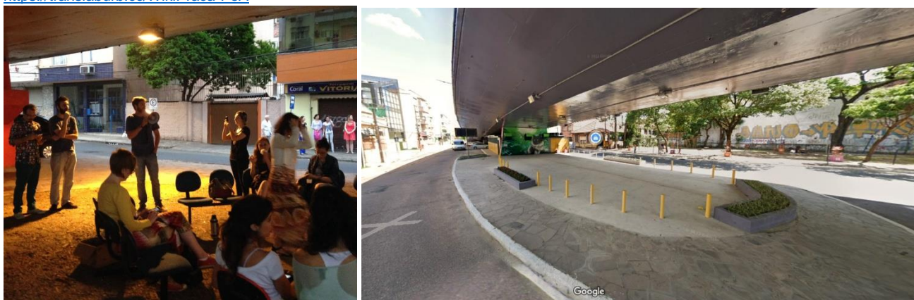
FIG. 4 Imagen de uno de los encuentros tácticos con organizaciones sociales en el lugar.