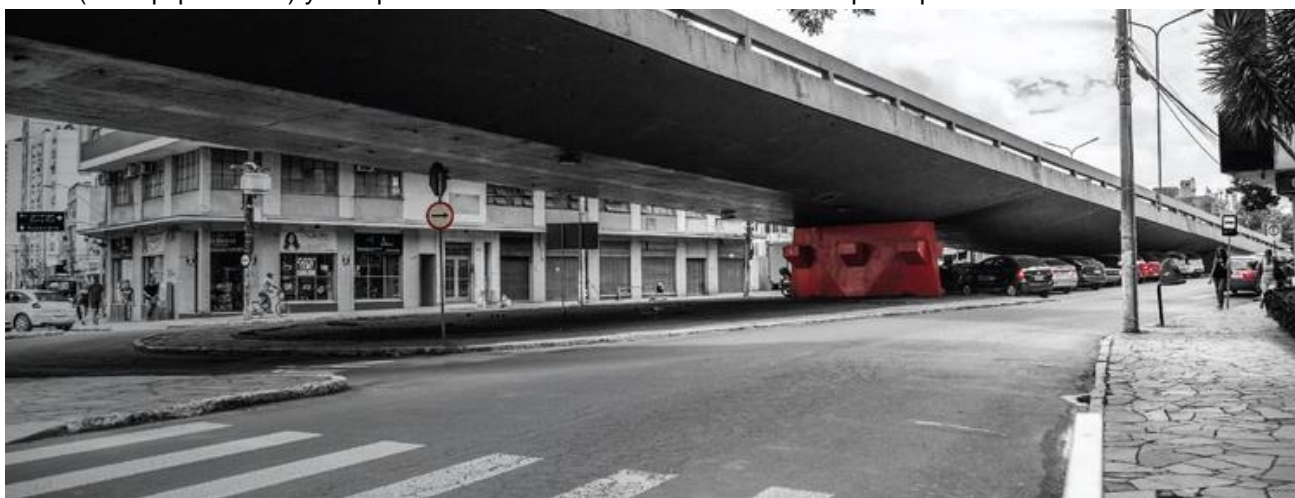
FIG. 3 Imagen del espacio bajo el viaducto Silva Só antes de la intervención. Fuente: TransLab Urb 2014. Publicado en: https://translaburb.cc/WikiPraca-PoA

La Wikipiazza - Viaducto da Silva Só (ver fig. 3, 4 y 5) es un proyecto ejecutado por el colectivo en el año 2014. El soporte espacial es un lugar de conflictos asociados a la movilidad caótica y la inseguridad: los espacios residuales bajo puentes, viaductos y/o infraestructuras elevadas. Estos territorios resultan ser espacios contaminados y basurales, albergues de personas en situación de calle y/o espacios vacíos y focos de inseguridad. La wikipiazza se encuentra bajo el viaducto de Tiradentes en un sector próximo al centro histórico de la ciudad de Porto Alegre, con una trama urbana definida de usos del suelo mixtos. En su entorno inmediato hay en la mayoría comercios y frente al espacio wikipiazza existe otro espacio público del tipo plaza de escala micro (sin equipamiento) y una parada de ómnibus del sistema de transporte público.