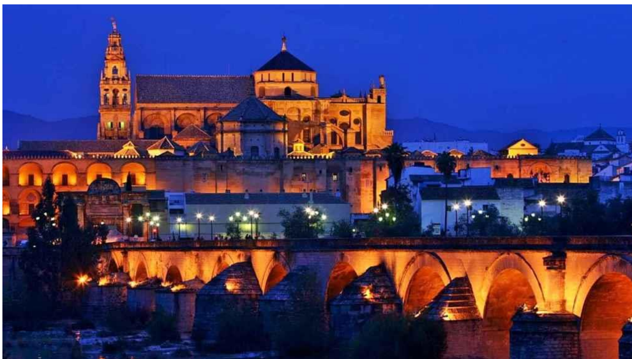
Imagen 1. Mézquita de Córdoba.

En el año 2019 los turistas que pernoctaban en las ciudades patrimonio de la humanidad de España suponían un 5% del total nacional (INE, 2020), en estos 20 últimos años el incremento de 200%, muy similar al incremento nacional.