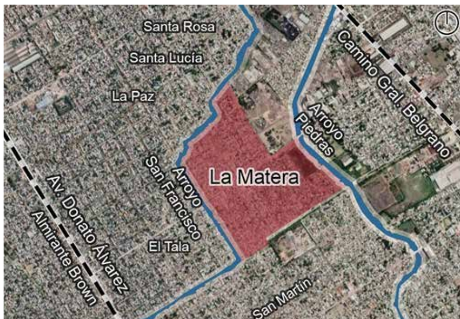
Fig. 08: Localización de La Matera entre las cuencas de los arroyos Piedras y San Francisco. Elaboración propia a partir de datos de Google Maps.

las acciones como parte de un programa piloto que se implementaría también en los municipios de Lomas de Zamora, Mercedes y Berisso. Como primera instancia de trabajo colectivo junto a las vecinas, el 13 de octubre de 2022 se desarrolló una reunión en la sede municipal junto a informantes claves (que conocían las problemáticas del sector). La segunda actividad participativa (ver figura 09) se llevó a cabo el 25 de octubre en un comedor comunitario donde funciona una copa de leche y una ludoteca. Allí, se reunieron, aproximadamente, treinta mujeres entre vecinas del barrio (mencionadas como referentas), funcionarias locales, e integrantes del equipo técnico para mapear y elaborar un listado sobre problemáticas y potencialidades que sirvan como base para elaborar un Plan de Sector, con identificación de ejes estratégicos y componentes de intervención urbana.