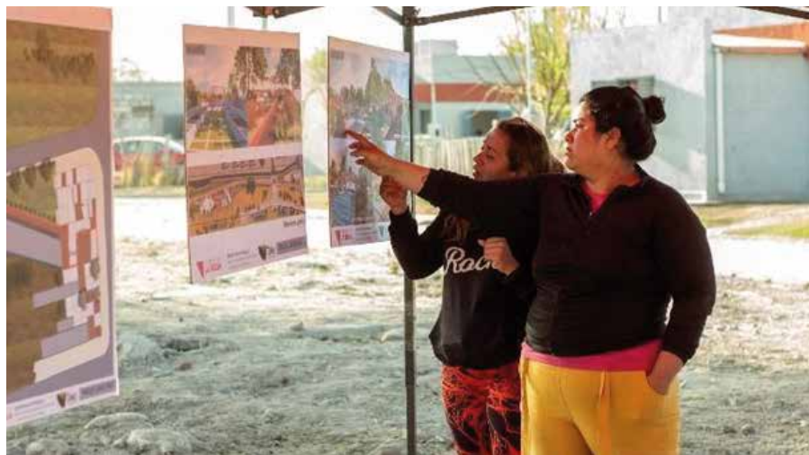
Fig. 06: Presentación del proyecto ante los vecinos del barrio Susana Quintela.

El día 14 de agosto el anteproyecto se presentó en el barrio (ver figura 06), junto a los vecinos, aprovechando para registrar la opinión de algunos participantes. Algunos días antes, el 2 de agosto, en una presentación institucional en la casa de gobierno de la Rioja, el trabajo se había presentado ante autoridades provinciales, haciendo entrega formal del anteproyecto a las dependencias técnicas encargadas de su construcción. Pese al carácter de urgencia con el cual se solicitó la elaboración del anteproyecto, a principios del 2024 el legajo técnico todavía no ha sido elaborado y la crisis de la economía nacional ha postergado su construcción.