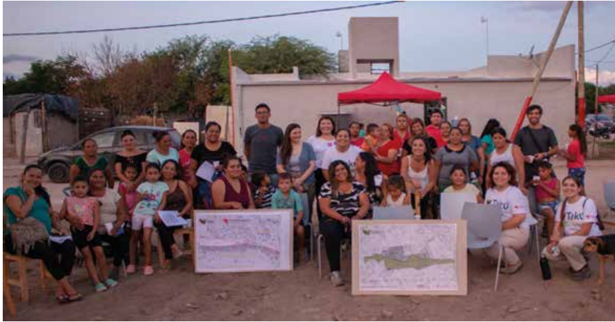
Fig. 03: Primera jornada de trabajo en el territorio, barrio Susana Quintela.

sibles disposiciones de las actividades registradas. Luego de un cierre formal del encuentro, el equipo contaba con dos propuestas de espacialización de actividades -una por cada grupo que realizó el recorrido- y un registro de comentarios y apreciaciones generales realizadas por los vecinos.