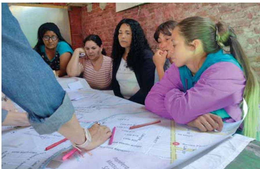
Fig. 09: Jornadas de trabajo en un comedor comunitario del barrio La Matera.

las acciones como parte de un programa piloto que se implementaría también en los municipios de Lomas de Zamora, Mercedes y Berisso. Como primera instancia de trabajo colectivo junto a las vecinas, el 13 de octubre de 2022 se desarrolló una reunión en la sede municipal junto a informantes claves (que conocían las problemáticas del sector). La segunda actividad participativa (ver figura 09) se llevó a cabo el 25 de octubre en un comedor comunitario donde funciona una copa de leche y una ludoteca. Allí, se reunieron, aproximadamente, treinta mujeres entre vecinas del barrio (mencionadas como referentas), funcionarias locales, e integrantes del equipo técnico para mapear y elaborar un listado sobre problemáticas y potencialidades que sirvan como base para elaborar un Plan de Sector, con identificación de ejes estratégicos y componentes de intervención urbana.