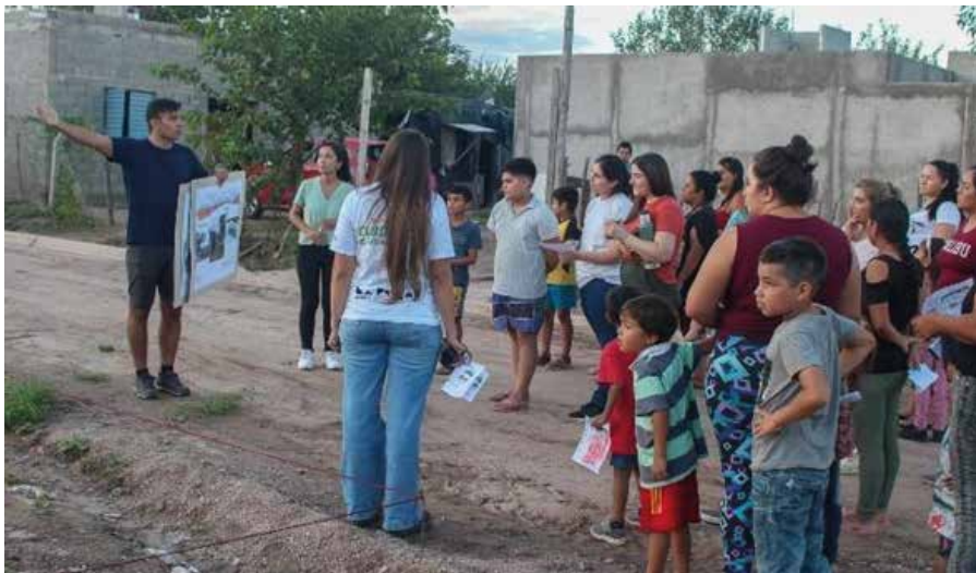
Fig. 04: Recorrido del replanteo en el sitio, barrio Susana Quintela.

El 27 de marzo se realizó la segunda jornada de trabajo que convocó a unas treinta personas para comenzar llenando una breve encuesta que repasaba el proceso realizado e indagaba en las preferencias individuales de cada participante con respecto a las disyuntivas a resolver.