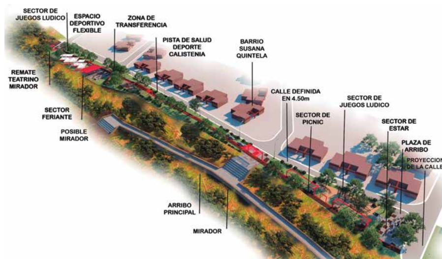
Fig. 05: Anteproyecto de la plaza lineal para el barrio Susana Quintela.

gabinete donde el equipo técnico realizó un anteproyecto definitivo (ver figura 05), que fue presentado oficialmente en dos oportunidades.