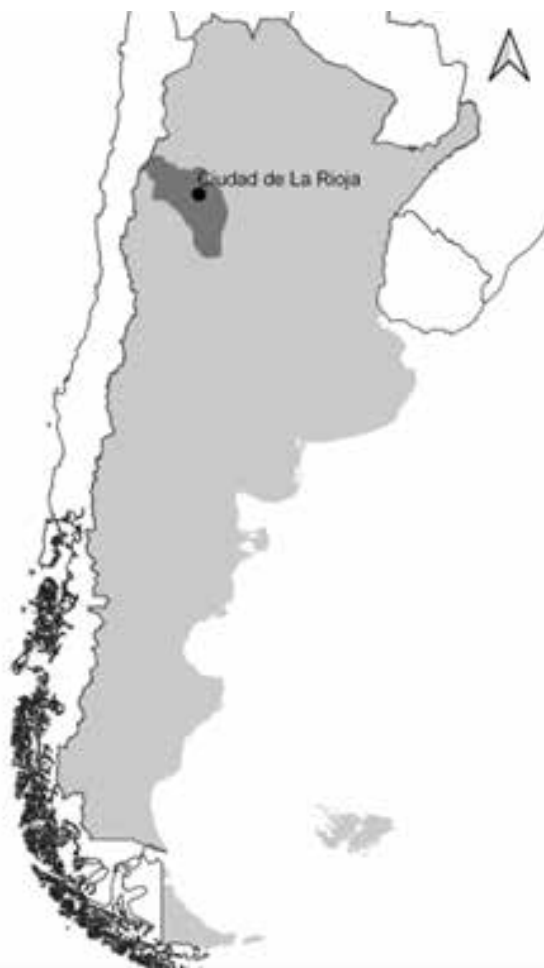
Fig. 01: Localización geográfica de la intervención en La ciudad de La Rioja.