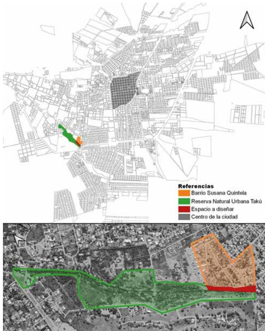
Fig. 02: Localización urbana de la plaza lineal diseñada participativamente.