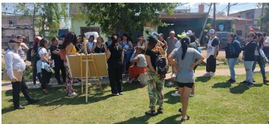
Fig. 10: Recorrido por el barrio La Matera siguiendo un sistema de postas. Registro propio.