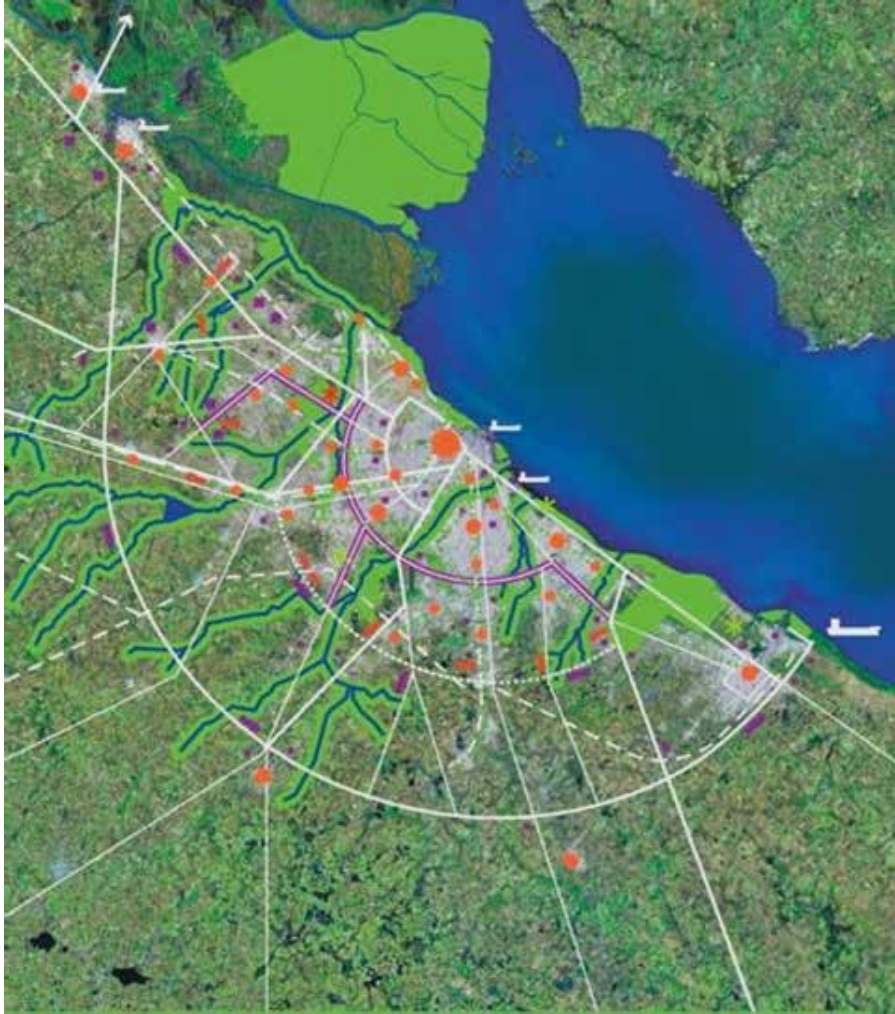
Figura 1. Modelo territorial propuesto por los LERMBAs. Fuente: DOUyT, 2007

dinámicas de una de las áreas metropolitanas más grandes y pobladas del mundo, que abarca 96 administraciones y tres gobiernos estatales. Este programa surgió en un contexto donde la gestión supralocal del Valle de México enfrentaba desafíos significativos, incluyendo la falta de un marco jurídico integral, la ausencia de participación efectiva y desigualdades socio-medioambientales (POZMVM, 2016).