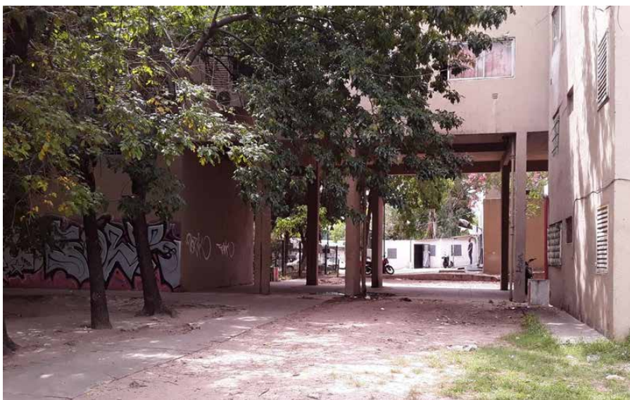
Fig. 04 Conjunto Urbano Soldati. Registro del estado actual del uso de los distintos espacios.

En cuanto a la Identidad, a través del estudio de imágenes anteriores y de los planos iniciales, es posible entender la evolución del espacio, las diferentes ocupaciones dadas por sus habitantes en términos de sectorizaciones, actividades que se fueron potenciando en cada lugar (sectores comerciales de origen que fueron mutando a través del tiempo, sectores de juego proyectados que no han sido fructíferos y se fueron deteriorando) lo que va de la mano con el entendimiento de las necesidades que se fueron presentando a través de los años (Figura 04). Además se analizan imágenes satelitales temporales que nos indican la evolución también del espacio circundante al conjunto habitacional, para darnos una idea de cómo fue modificándose ese paisaje.