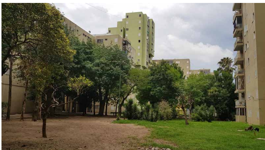
Fig. 03 Conjunto Urbano Soldati. Registro de la vegetación existente en cada sector del espacio común.

En el caso del conjunto urbano Soldati, en cuanto al Diseño, se ha recabado información sobre el proyecto inicial, sus características originales, la revisión de los planos y croquis de obra. Se iniciaron relevamientos por sectores, debido a la magnitud del conjunto, para tener un detalle pertinente de cada sector de análisis. En los relevamientos se observan las distintas características del paisaje actual, su vegetación, el porte, estado, ubicación y magnitud de la misma (Figura 03), como así también las distintas materialidades con las que nos encontramos: senderos de hormigón, senderos espontáneos sin demarcación, equipamiento para descanso y para juegos, estado de cada elemento. A la vez la observación del lugar permite un registro de las actividades que se desarrollan.