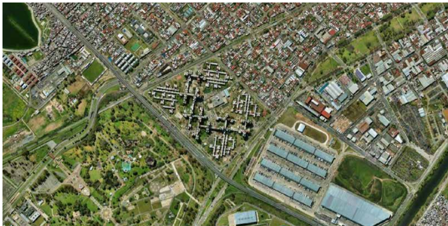
Fig. 02 Conjunto Urbano Soldati. Hacia el norte limita con un tejido de baja densidad, hacia el sur la autopista lo separa del Parque de la Ciudad.

Tomando como punto de partida la distribución de los interrogantes en los ejes Diseño, Gestión e Identidad se organiza el trabajo para poder tener un entendimiento de la situación del espacio común del conjunto habitacional a estudiar. De esta manera, a partir de relevamientos, visitas, observaciones, se van registrando las características del espacio y sus posibles puntos de mejora.