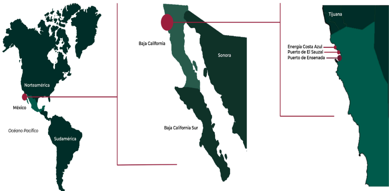
Fig. 02 Localización del sitio de estudio en Ensenada, México.

Cabe mencionar que la investigación se encuentra en la etapa C, específicamente en: la revisión sistemática de la literatura y el diseño de instrumentos de medición, mismos que serán enviados a validación por expertos en el tema. Por medio de dicha revisión de la literatura, se definieron las siguientes categorías: a) las identidades urbanas, con sus subcategorías de: reconocimiento, pertenencia, permanencia y vinculación; b) las transformaciones socioespaciales, con: legibilidad, conectividad y seguridad; y, c) el turismo, con el impacto que éste produce. Cabe mencionar que se analizaron tres espacios de Ensenada, de los cuales se seleccionó como caso de estudio al malecón de la ciudad (Figura 02).