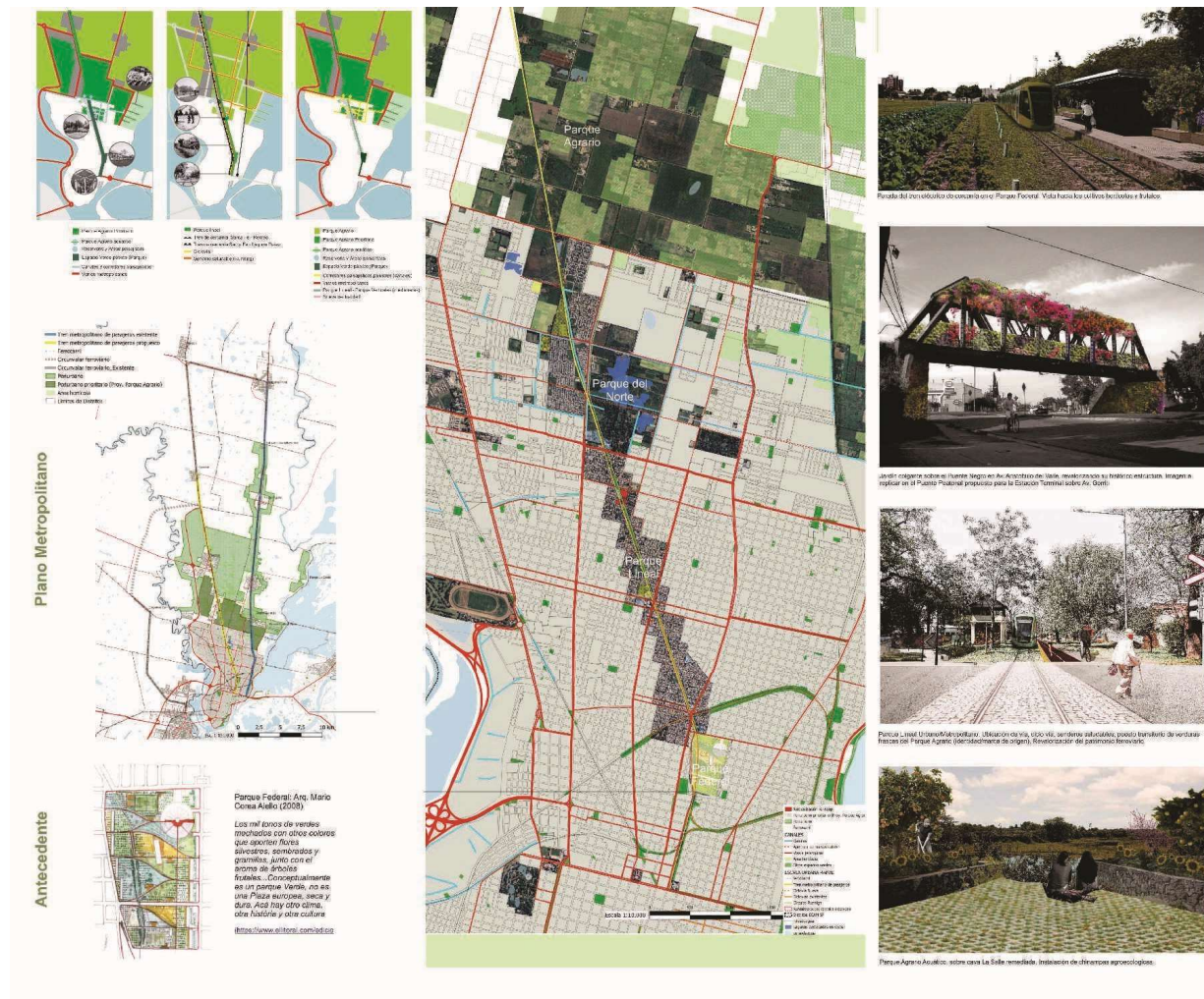
Fig. 2. Imágenes de los paneles de los paneles presentados para el Concurso Trazas para re-armar una ciudad humedal. Fecha: noviembre 2023.

La propuesta para una Santa Fe 2050 es reflexiva sobre los usos posibles en los corredores del ex FFCC tomando como premisa preservar la integridad del conjunto de trazas, infraestructuras y espacios colindantes en un sistema vivo que se adecúa a las dinámicas contemporáneas. El concepto Trazas para re-armar una Ciudad Humedal representa una idea situada de Parque Lineal, sostenible en diversos niveles ambientales, geográficos, históricos, urbanísticos, educativos, productivos; propuesta que se estructura en las dimensiones metropolitana, urbana y barrial con anclaje en el paisaje y los jardines comestibles como elementos de transformación.