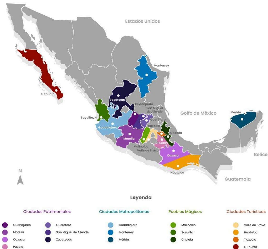
Fig. 02 Investigaciones de gentrificación en México.

También se ha identificado este fenómeno urbano en Pueblos Mágicos 3 del país (ver figura 2), en Valle de Bravo se incorpora en 2005 y Malinalco en el año 2010, ambos pertenecen al Estado de México; seguido de Cholula en el estado de Puebla en 2012, y Sayulita Nayarit en el 2015. Todas las investigaciones se desarrollaron después de su incorporación al programa de fomento al turismo encabezado por la Secretaría de Turismo (SECTUR) en ciudades como: Valle de Bravo (Navidad, 2021), Malinalco (Castro y Ochoa, 2006; Hoyos y Sánchez, 2007; Valverde y Jasso, 2017; Vázquez, 2022), Cholula (Hernández, 2023) y Sayulita (López et al. 2019), este dato muestra que el programa podría ser un elemento clave del desarrollo de gentrificación y/o turistificación. Además, de las zonas de turismo de playa como Huatulco en Oaxaca (Ríos et al. 2022), sitios de turismo artificial y/o fabricado como la Toscana mexicana Val'Quirico en Tlaxcala inaugurado en el 2014 (Salas y González, 2019), y casos con gentrificación rural y turística en El Triunfo, Baja California Sur (Bojórquez et al. 2022).