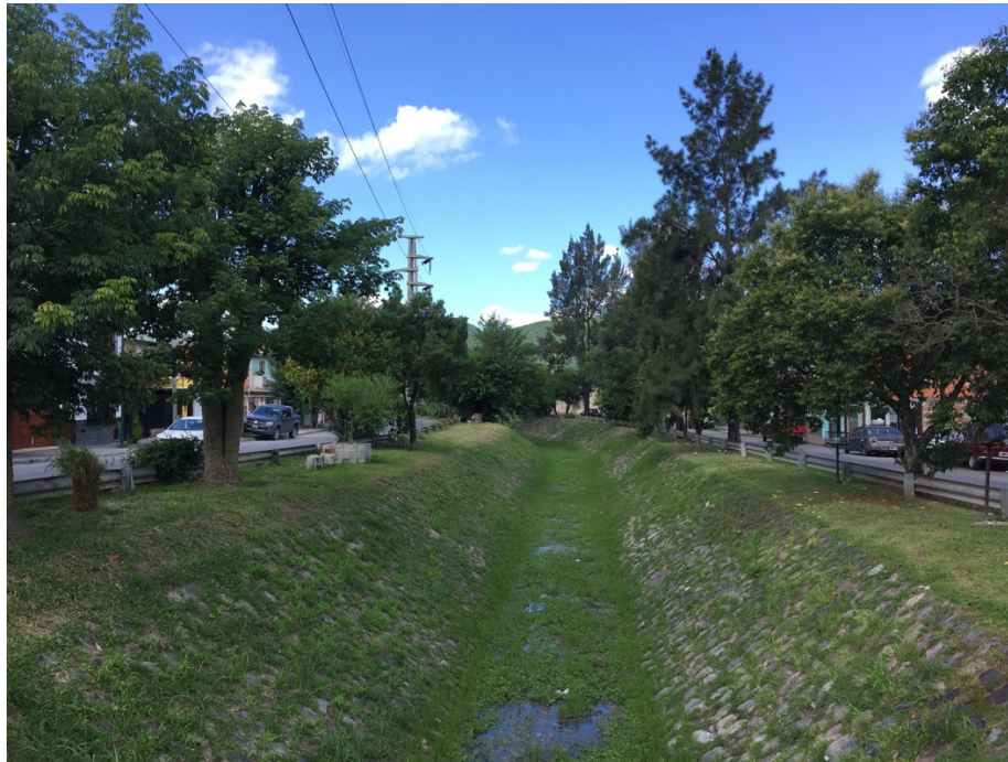
Fig. 4. Arroyo sobre av. Constitución.

El peor valor es el de Ao. Yrigoyen sin valor social, recreativo ni escénico y coincidiendo con una vía vehicular de conexión urbana de alto tránsito (Fig. 5).