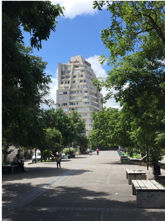
Fig.7. Arroyo Esteco Soterrado.

A fin de mejorar los índices de Calidad de bosque de ribera sería necesario garantizar la cubierta vegetal existente y llevar a cabo proyectos de restauración que mejorara el canopeo arbóreo o cobertura con especies nativas. Para incrementar los beneficios que aportarían los canales urbanos se debería trabajar en especial en incrementar los beneficios ecológicos, sociales y económicos. Para los primeros, sería imprescindible disminuir el porcentaje de superficies impermeables lo cual permitiría el arraigado de vegetación, especialmente palustre. Esto, sumado a mantener un espejo de agua, aumentaría la oferta de hábitat de fauna. Una mixtura de usos en los predios frentistas mejoraría en el eje económico y aportaría al social, con mayor presencia de gente en la calle. Para esto, sería adecuado mejorar o incorporar mobiliario urbano que permitiera a la gente sentarse y practicar actividades físicas activas.