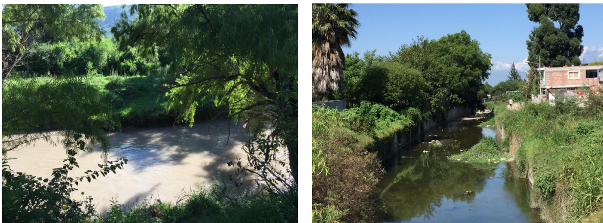
Fig.3. (izq.) Rio Arenales y Calle Japón – calidad muy buena, (der.) Arroyo Velarde y Pte Julio Paz – calidad mala.

La mayoría de la cubierta vegetal es autóctona ( Salix humboldtiana , Prosopis alba , P. nigra , Anadenanthera colubrina , Manihot grahamii , Celtis ehrenbergiana , Schinus areira , Tecoma stans ), en algunos sitios acompañan especies exóticas como Mora sps., Eucaliptus sp. Ricinus communis , Melia azedarach , Ligustrum lucidum , Tamarix gallica , Ulmus procera , Acer negundo , Cupressus sp., Fraxinus pennsylvanica , Grevillea robusta .