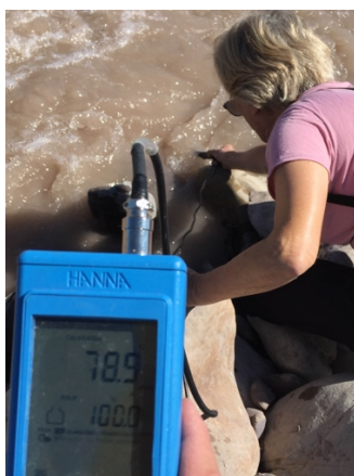
Fig.2 Muestro y toma de datos en Rio Arenales.

En cada sitio de muestreo se determinaron in situ la temperatura y la concentración de oxígeno disuelto (OD) en agua superficial (Fig. 2) las que fueron medidas utilizando sensores HI9146 debidamente calibrados. Los valores de 5-8 mg/l se consideran Aceptables y los de 8-12 mg/l Buenos, adecuados para la vida de la gran mayoría de especies de peces y otros organismos acuáticos.