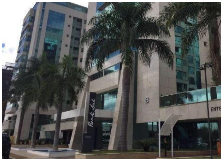
Figura 5 fachada principal.

Tal qual o condomínio Super Quadra Atlântica, o residencial Park sul possui uma gama considerável de equipamentos de lazer. O complexo é maior, com 676 apartamentos frente aos 308 do outro empreendimento. A face do maior volume, o Park Sul Prime Residence oferece mais opções de lazer sem onerar o condomínio. Por outro lado, mais moradores fazem com que a procura pelas instalações seja maior. As fotos a seguir demonstram que se trata de um complexo similar a alguns resorts que existem no país, com parque de piscinas e outras comodidades que atraem várias famílias que buscam a segurança, prometida pelo modelo de condomínio fechado, bem como as instalações de lazer sem precisar sair do conjunto onde vivem. As razões para as pessoas preferirem não sair dos condomínios onde moram parecem guardar relação com dois fatores principais: a segurança, onde saídas do complexo são potenciais situações de risco; e o trânsito, na medida em que Brasília é uma cidade rodoviária, com prioridade dada ao meio de transporte individual, com transporte público de baixa qualidade. O resultado são ruas cheias e dificuldade para encontrar estacionamento, fazendo com que as pessoas optem por permanecer em casa e ali mesmo terem os equipamentos de lazer disponíveis.