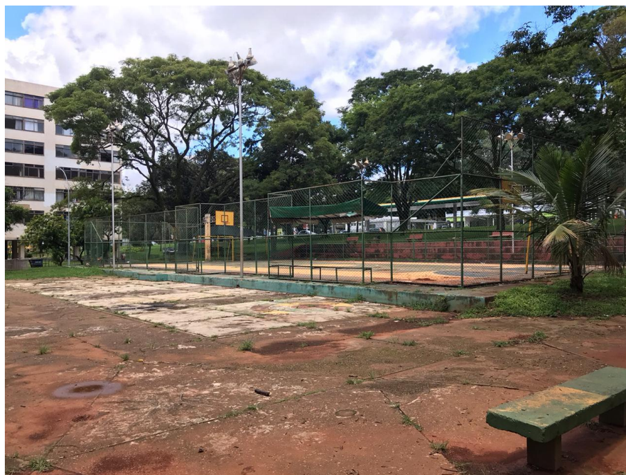
Figura 10 Quadra de esportes.

As fotografias da SQN 113 mostram uma quadra com edifícios demandando manutenção, além disso, as áreas comuns e de lazer também encontram-se em estado precário para uso e circulação de pessoas. A quadra de esportes, por exemplo figura 10, está em péssimo estado, com seu entorno totalmente danificado. as calçadas, figura 12, apresenta piso rachado e irregular, inapropriado, sobretudo para pessoas com dificuldade de locomoção ou portadores de necessidades especiais.