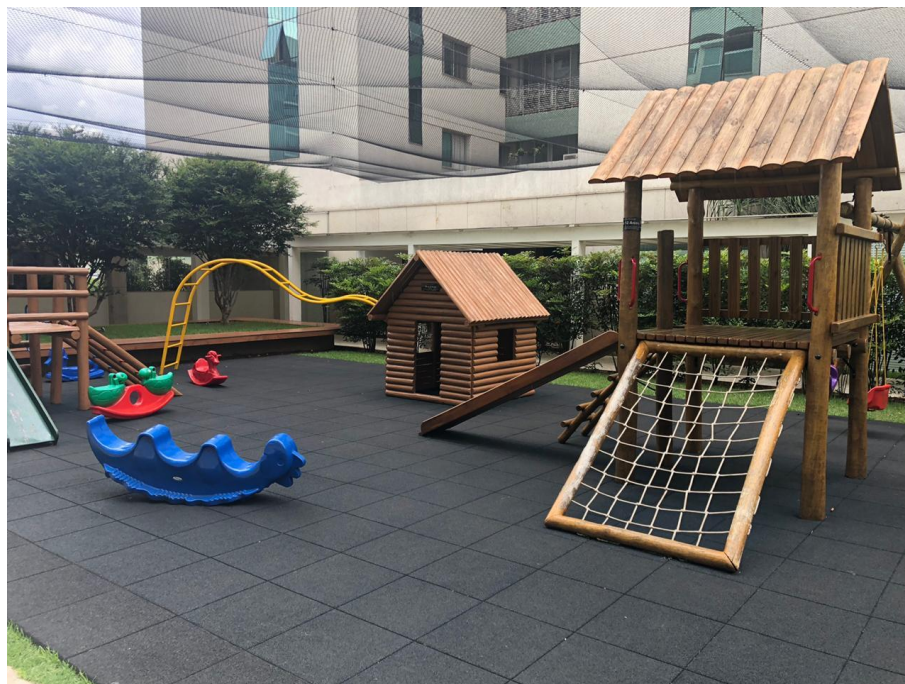
Figura 8 parque infantil.