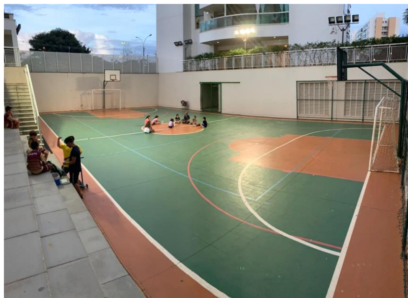
Figura 2 quadra de esportes.