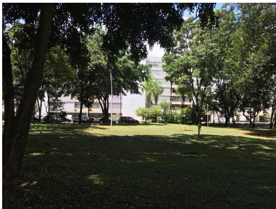
Figura 13 área verde na SQS 113 com prédio residencial ao fundo.

As figuras 13, 14 e 15 ilustram as afirmações acima, é possível observar muitas árvores, um grande gramado e uma fachada de um edifício residencial em bom estado. No instante em que as fotos foram tiradas, na figura 14 é possível ver crianças de uma escola pública situada na mesma quadra desenvolvendo atividades recreativas. Chama atenção também a ausência de pessoas caminhando pelas vias ou desfrutando das sombras abundantes que as árvores propiciam. O número de veículos estacionados evidencia a condição de cidade rodoviária, com a prioridade dada ao automóvel.