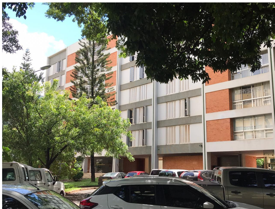
Figura 15 prédio residencial em bom estado de conservação.