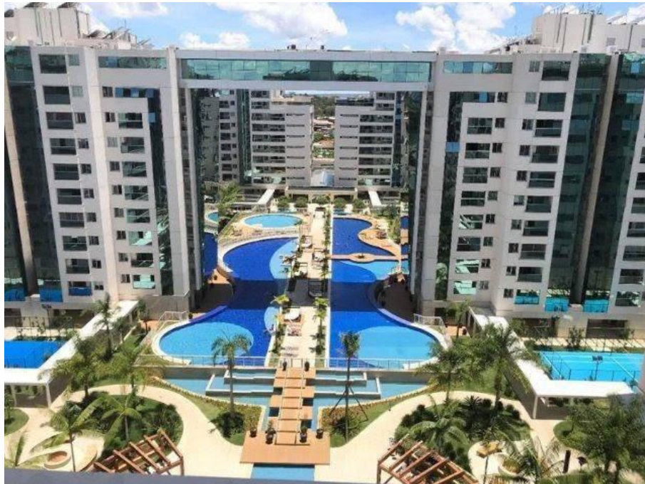
Figura 6 vista aérea da área de lazer.