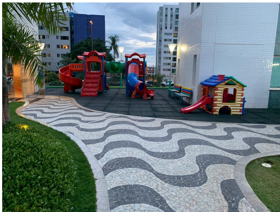
Figura 4 brinquedos infantis.