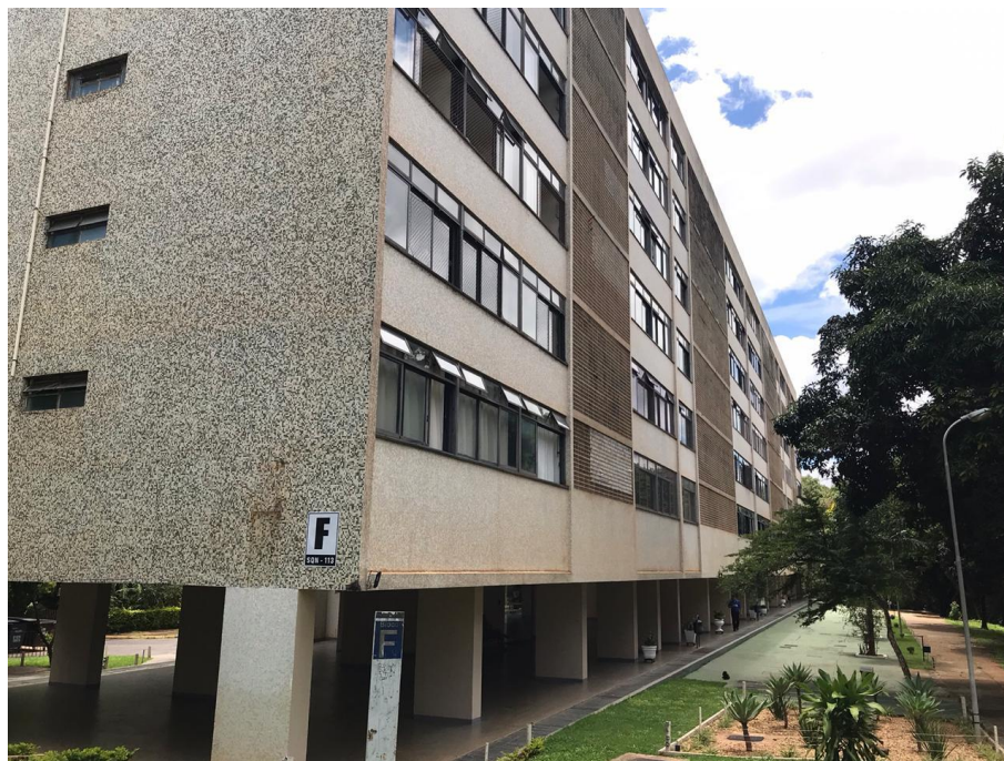
Figura 11 fachada de um dos prédios da quadra.