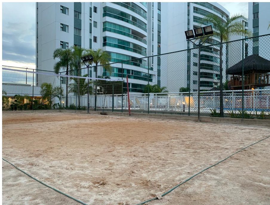
Figura 3 quadra de areia.