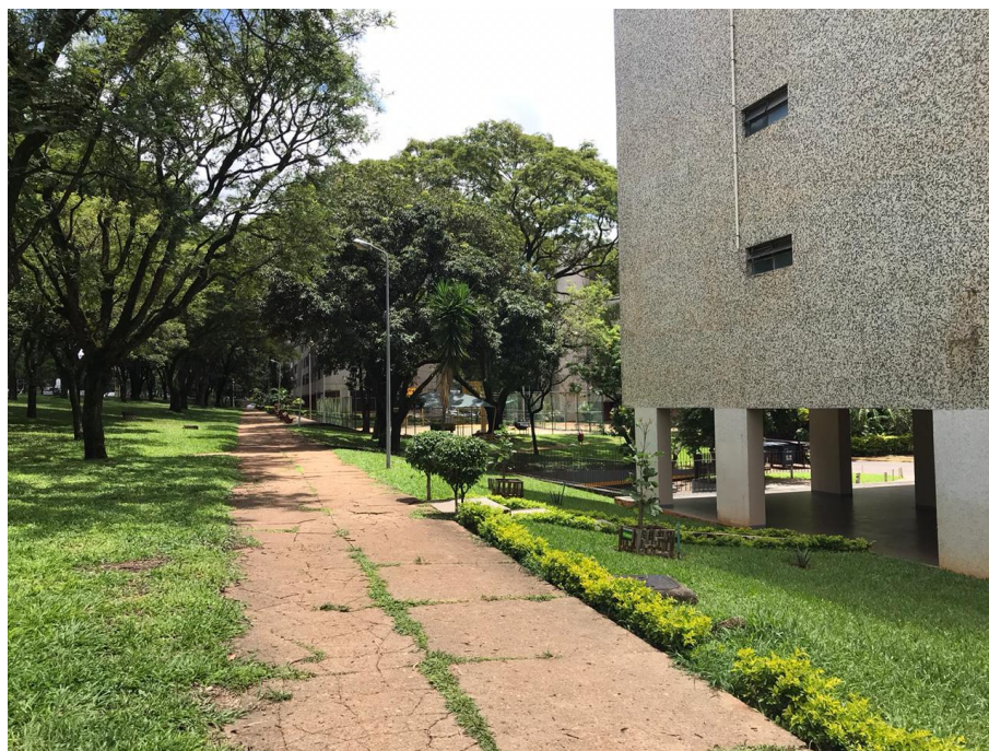
Figura 12 calçada da quadra com sinais de deterioração.