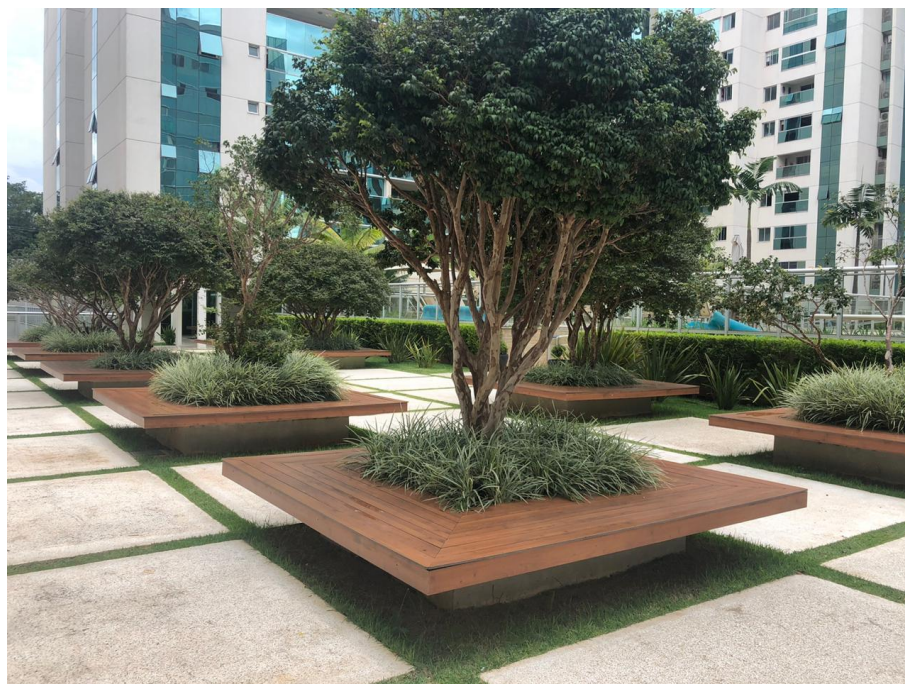
Figura 7 jardim interno.