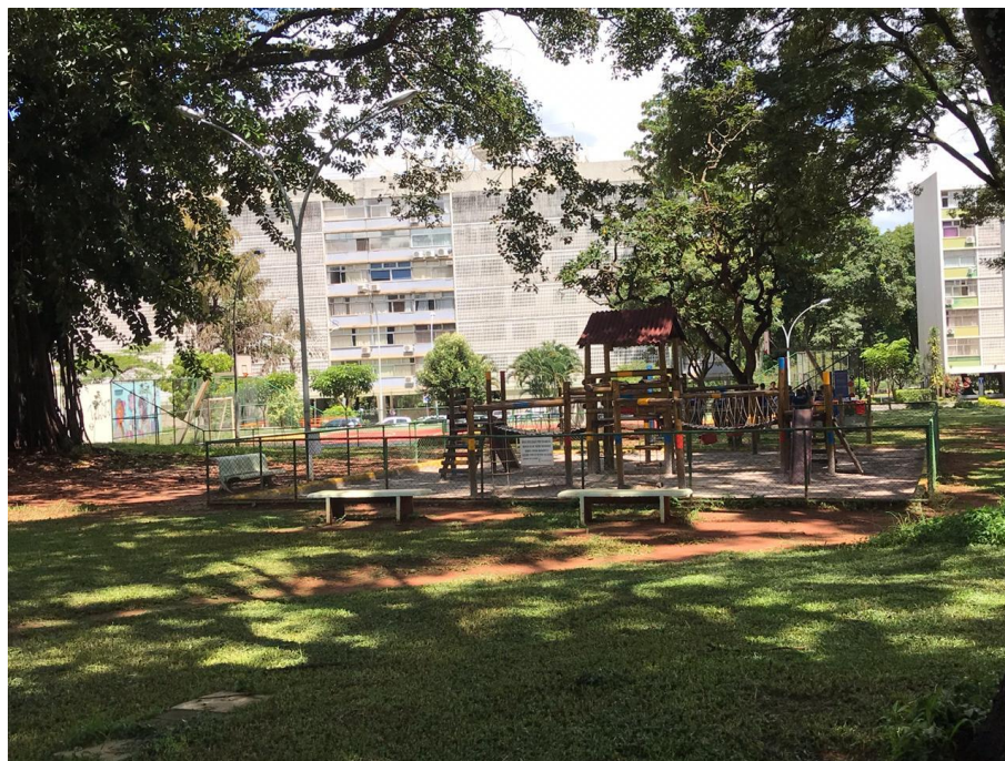
Figura 14 parque infantil no interior da SQS 113.