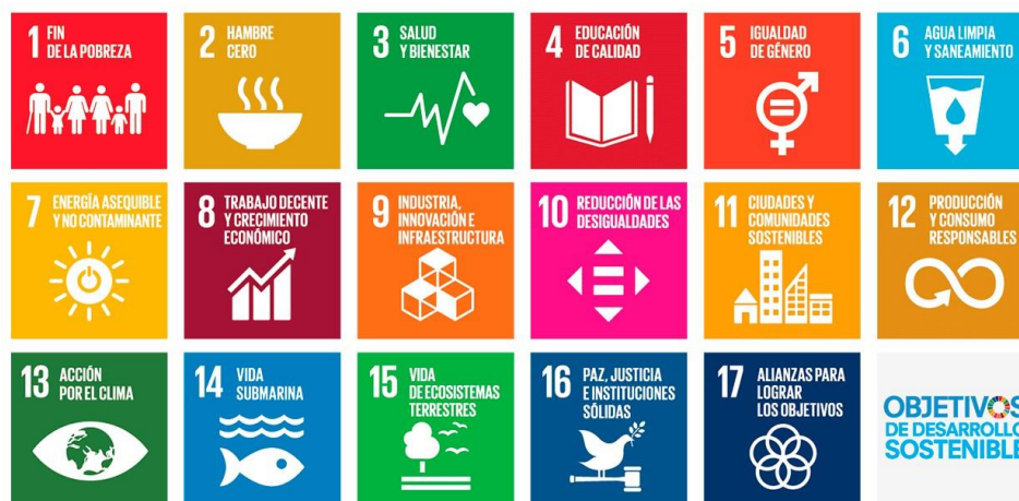
Fig. 1. Listado de Objetivos de Desarrollo Sostenible.